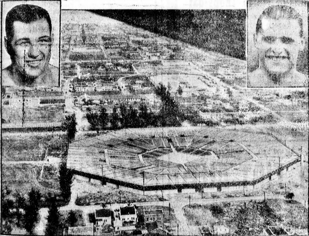
A Madison Square stadion Miami Beachben, ahol a boxmérkőzés lefolyt. Baloldalt fenn Jack Sharkey a győztes, jobboldalt

A harmadik menetben Sharkey teljes dühvel rohant az angolra, egyik ütése a másik után érte Scottot, aki a földre került, ahol a bíró kiszámolta. A győztes Sharkeyt a közönség nagy ovációban részesítette.