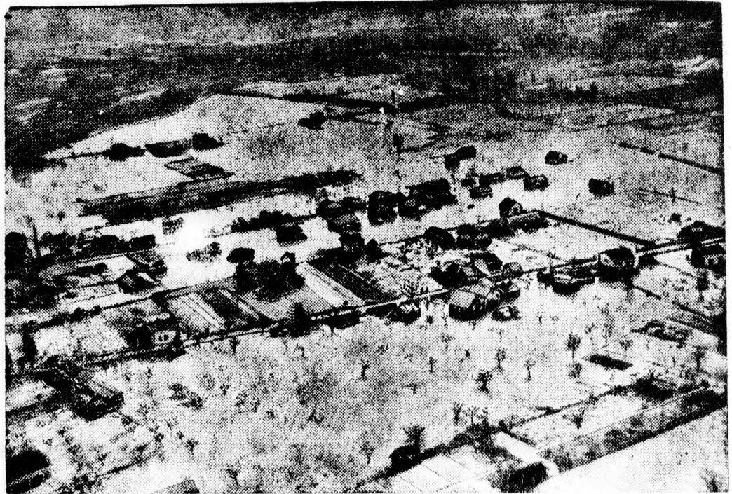
Repülőgépfelvétel az árvizsújtotta dél-francia vidékről.

Az árvizkárosultak javára megindított gyűjtés eddigi eredménye meghaladja a 13 millió frankot. Magánosok és vállalatok teljes áldozatkészséggel siettek az inséget szenvedők segítségére. A külföldről is igen sok adomány érkezett.