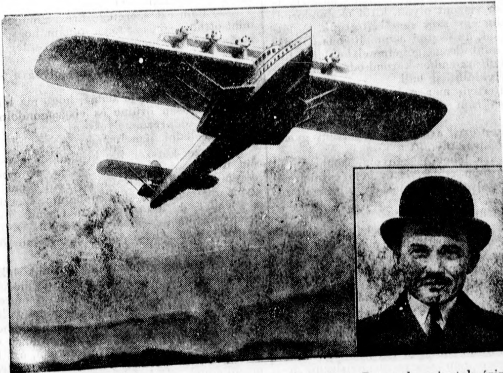
A Do X. óriás repülőgép Dornier Claudius mérnök vezetésével Amerikába repül az Azorok és Bermuda szigeteket érintésével.