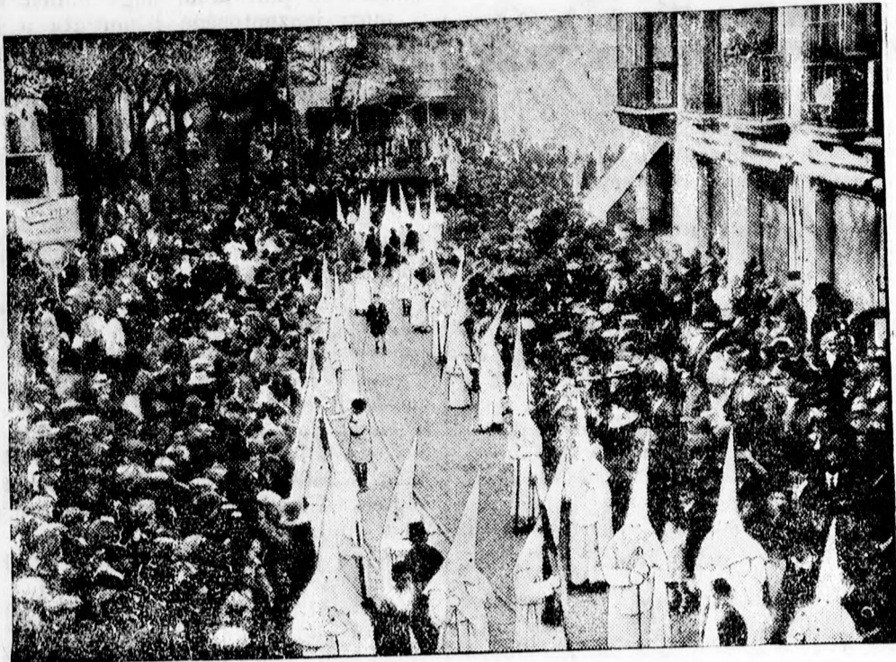
Spanyolországban husvét hetében ünnepélyes körmeneteket tartanak, amely alkalmakkor a szerzetesek fehér kámszával fedik el arcukat. Képünk a Madridban megtartott körmenetet mutatja.