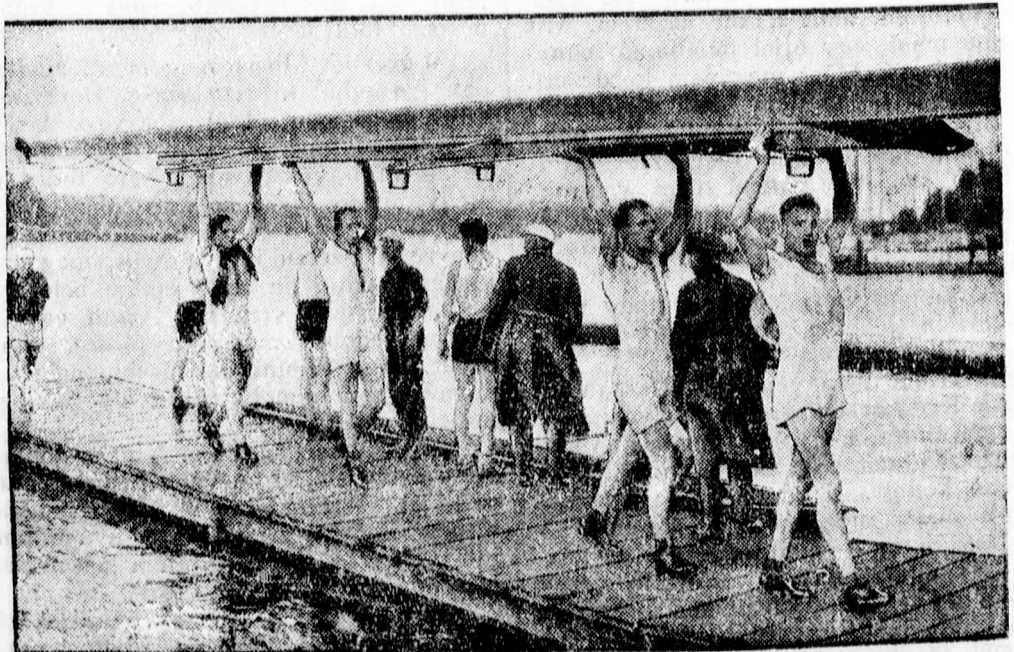
Megindult az evezős szezon

Komolyabb kulturális szórakozásban se lesz hiány a vásár alatt. A színházak legnagyobb sikerű darabjaikat mutatják be. Valamennyi muzeum, képtár nyitva lesz. A hangversenyek pódiumán európai híru művészek jelennek meg és akik a tudományban találják kedvüket azok egész sereg kongresszus vitáját hallgathatják végig.