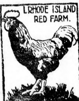
A noviszádi nemzetközi kiállításon I. és II. díjat nyerte.

Angliából és Dániából importált tenyésztőállatok. Előjegyzéseket elfogadok: