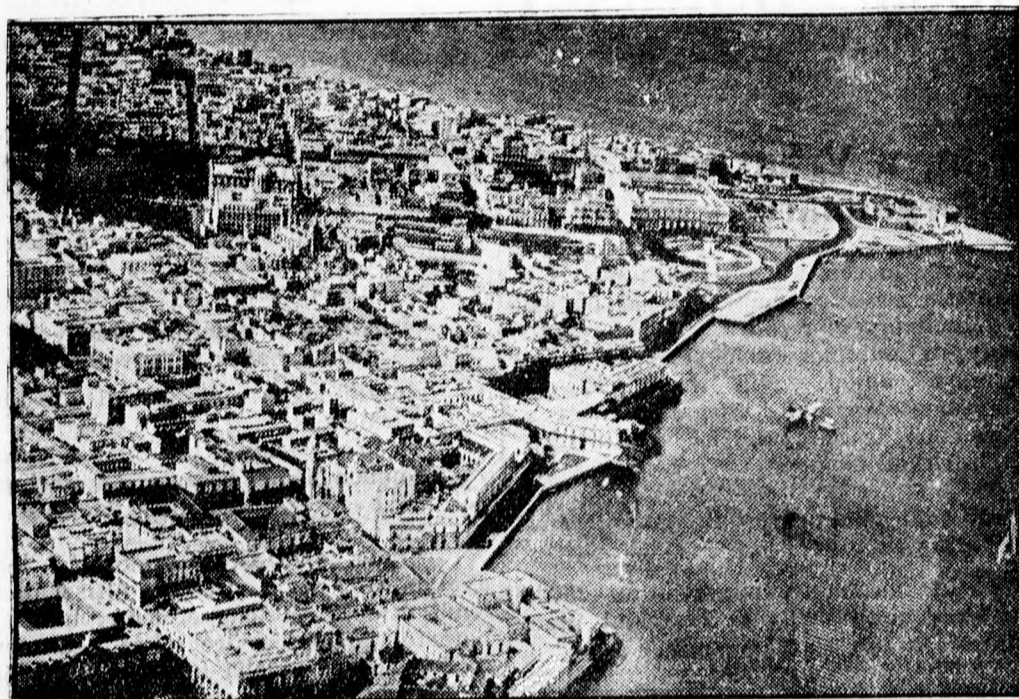
Havanna, Cuba sziget fővárosa, ahol szintén kiköt a Graf Zeppelin.

Pernambucoból jelentik: Egy hirtelen szélvihar a Graf Zeppelin motorgondolóját olyan erősen vágta a földhöz, hogy a gondola tokja, éppúgy mint az elmúlt évben Tokióban, eltört. A tokot sikerült hamarosan megjavítani. A newyorki Times tudósításában kiemelte azt a nagy érdeklődést, amellyel a lakosság a Zeppelin hétfői megérkezését kísérte.