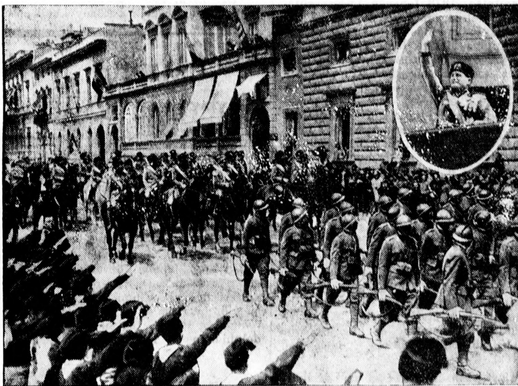
Mussolini bevonulása Firenzébe. — A jobb sarokban Mussolini beszél „Olaszország szomszédai ellen”.

A párisi lapok még mindig Mussolini firenzei beszédével foglalkoznak