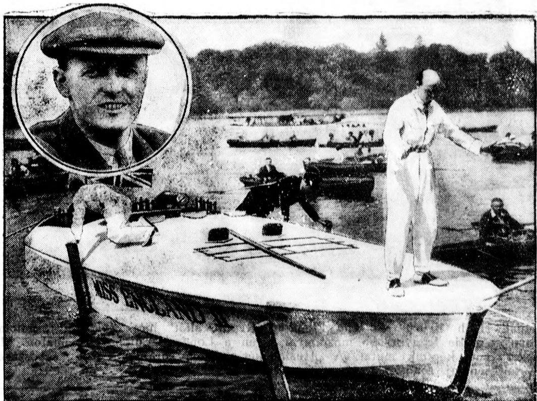
Segrave őrnagy és a „Miss England II“-nél felborult és ezzel az őrnagy halálát okozta.