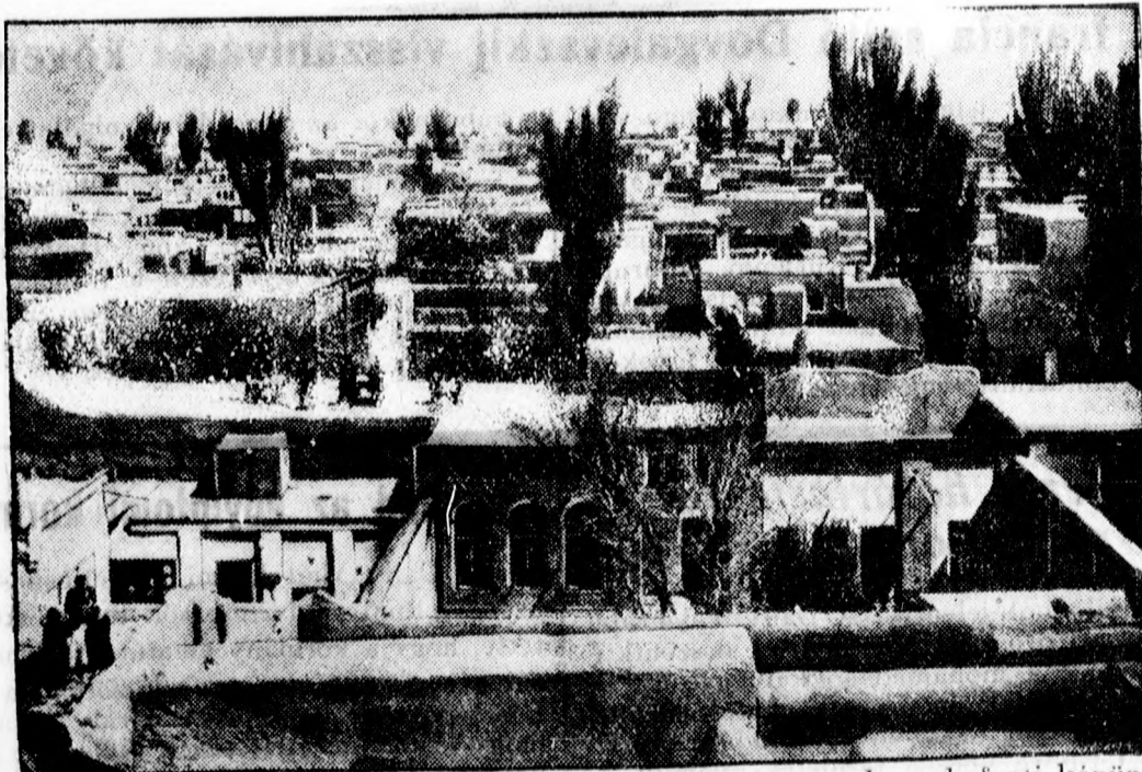
Tegnapi számunkban megírtuk, hogy Perzsiában nagy földrengés pusztított. Ezzel kapcsolatosan hozzuk fenti képünket, amely egy tipikus perzsa várost mutat.