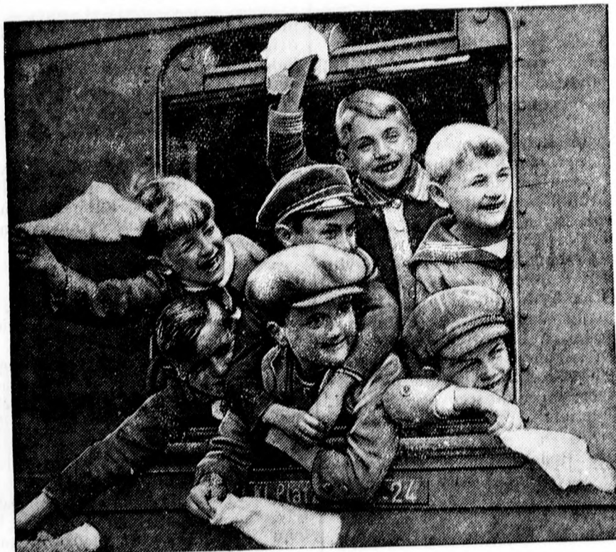
Jókedvű diákok örömmel bucsuznak a várostól és iskolától.