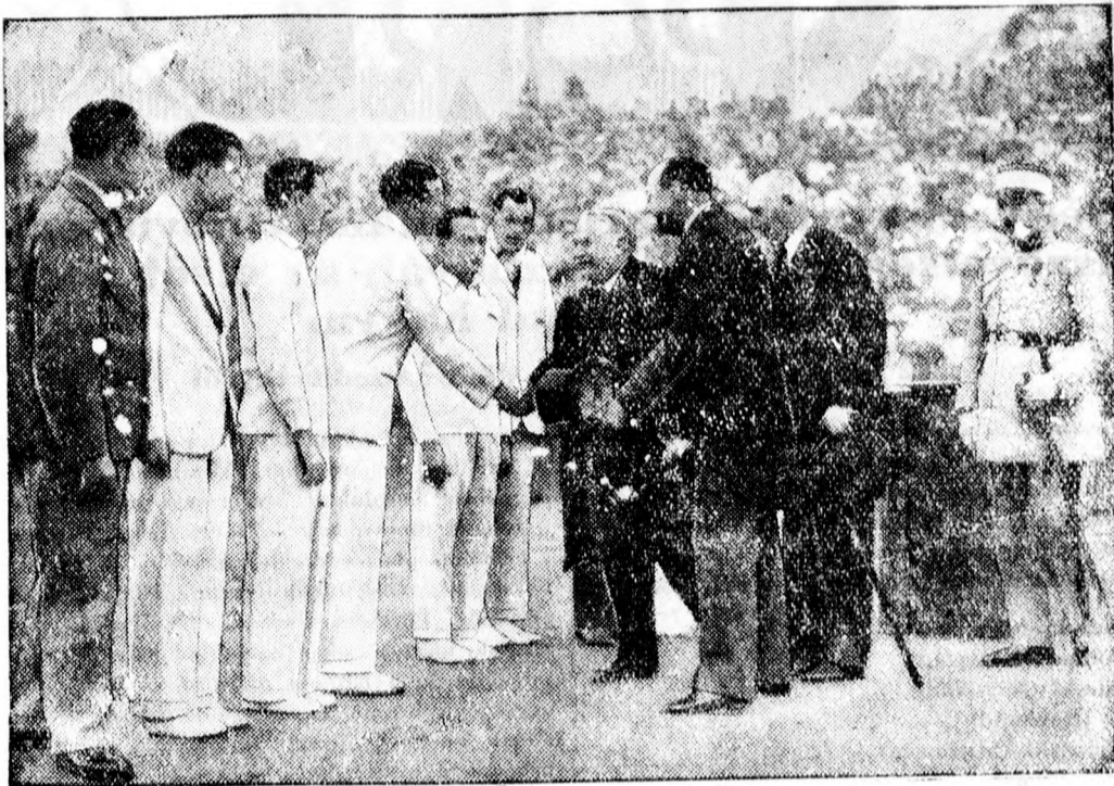
A Davis Cup mérkőzések befejezése után Doumergue francia köztársasági elnök üdvözölte a győztes hazai és a legyőzött amerikai csapatot.