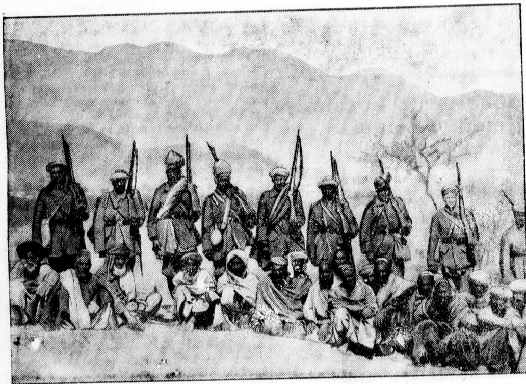
Indiai benszülött angol katonák őrzik az elfogott afridikat.

Az angol kaionaság megtörte az afridiak támadó erejét