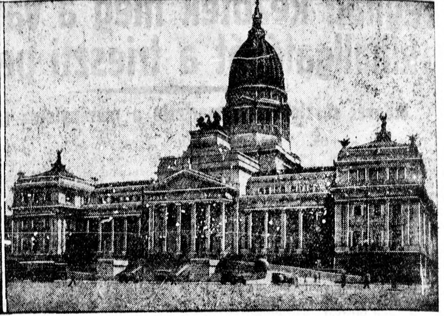
A parlament épülete Buenos Ayresben

Buenos Ayresből jelentik: A perui és bolíviai forradalom hatásait Argentiniában is érezteti, ahol az Irigoyen köztársasági elnökkel szemben évek óta elégedetlen ellenzék határozott lépésre szánta el magát és