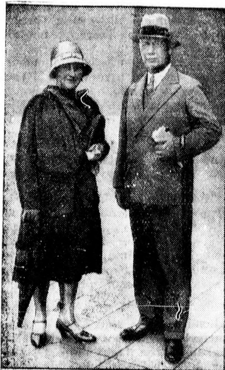
Kundt tábornok és felesége

Polgárok csak azok, akik írni és olvasni tudnak és akiknek legalább ötszáz boliviano