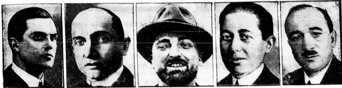
Prokope (Finn) Zaleski (Lengyel) Grandi (Olasz) Titulescu (Román) Benes (Csehszlovák)