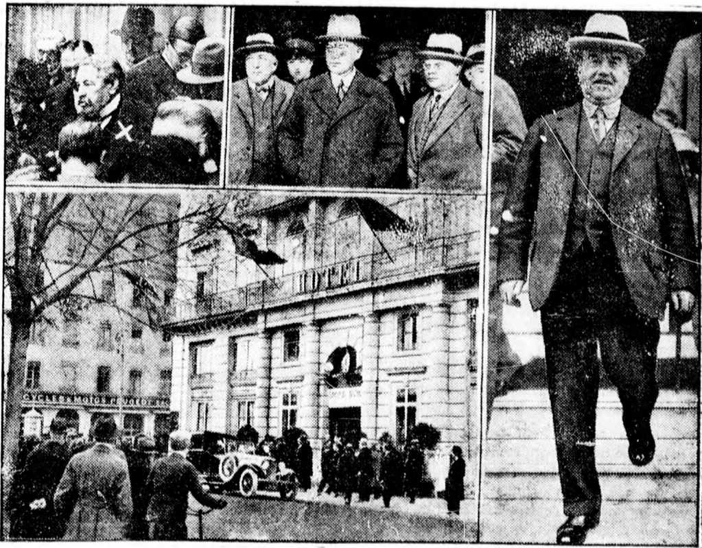
A Népszövetség ülészése

Noviszád környékén is nagy zivatar volt, amely azonban nem okozott nagyobb károkat, sőt az érésben levő szőlőt is megkímélte. Noviszádon a závorszerű eső csak annyiban használt, hogy eltüntette az utcákról a hatalmas port, tegnap reggelre azonban már nyoma sem volt az éjjeli zápornak.