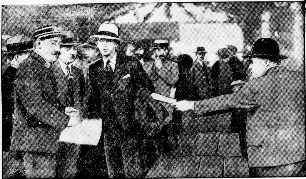
Amerika betörő királyának letartóztatása

A gimnáziumokba való özőnlés pedig azzal magyarázható, hogy a szülők könnyebb és biztosabb megélhetést vélnek biztosítani gyermekeiknek, ha a gimnáziumi tanulmányok befejezése után a köztisztviselői, vagy lateiner pályán igyekeznek elhelyezni. A középiskolákban tovább folyik a beiratkozás és így valószínű, hogy az első osztályu tanulók létszáma még emelkedni fog.