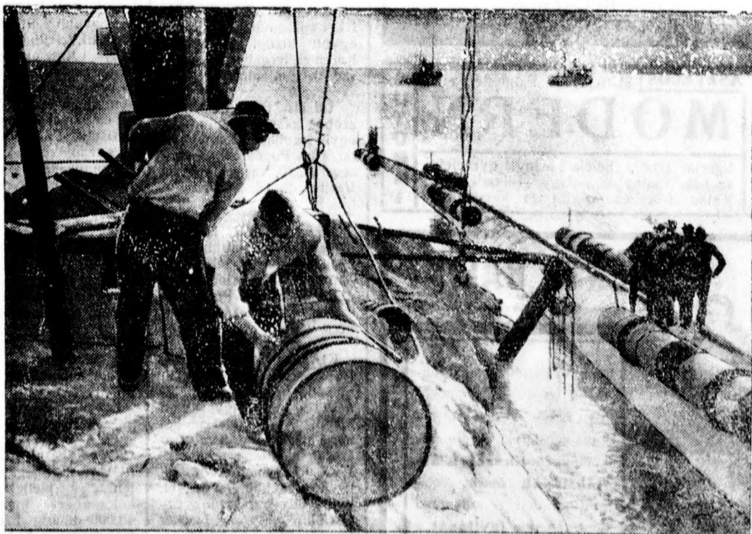
Villamoserőt állítanak elő a tenger vízből

George Claude francia fizikus már régebben foglalkozik azzal a gondolattal, hogy a Golf áram segítségével — amely a mexikói öbölből áramlik Európa felé — elektromos áramot nyerjen. Claude