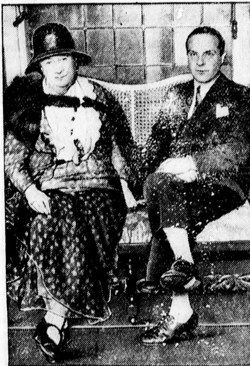
Hetvenhárom éves menyasszony negyvenhárom éves vőlegény

A földmunkás-szövetség közlése szerint az idei aratási évad a munkások részére meglehetősen rossz volt. Igen sok munkáscsalád maradt kenyér nélkül és ezek a legnagyobb nyomor elé néznek az idei tél folyamán, mert munkát aligha lehet találni. Viszont más munkások, akik munkához is jutottak, több helyen az aratási rendeletnek be nem tartása végett nem juthattak kellő keresethez és ezek ugyan csak súlyos gondok közepette várják a közelgő telet.