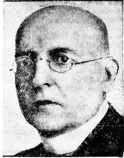
Dr. Seipel Ignác

Az új kormány hivatalbalépése után nyomban megkezdődik az új választások előkészítésének munkáját. A választásokat legkésőbb november 16-ig feltétlenül megtartják.