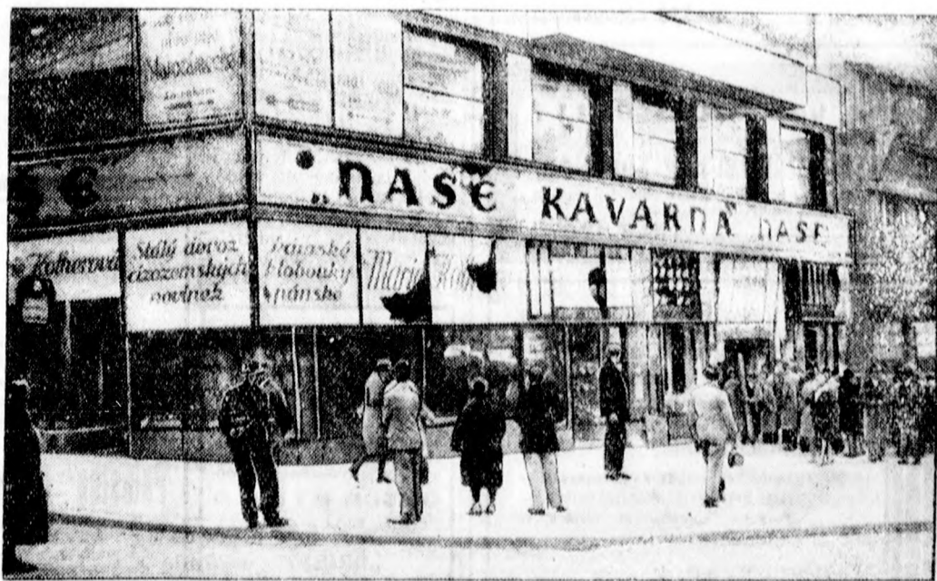
A PRAGAI TÜNTETÉSEK

Megirtuk, hogy Prágában tüntettek a német hangosfilmek ellen. A filmelleni tüntetésből német-