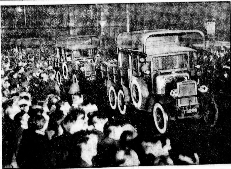
AZ R 101 HALOTTAINAK UTOLSO UTJA

Felső kép: A koporsókat autón szállítják a gyászoló ezrek sorfala között. Jobboldalt: A gyászmenet elhagyja a Szent Pál katedrális.