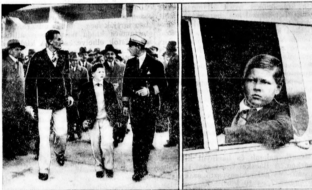
Mihály román trónörökös meglepetéssel a G. 38 óriásrepülőgépet