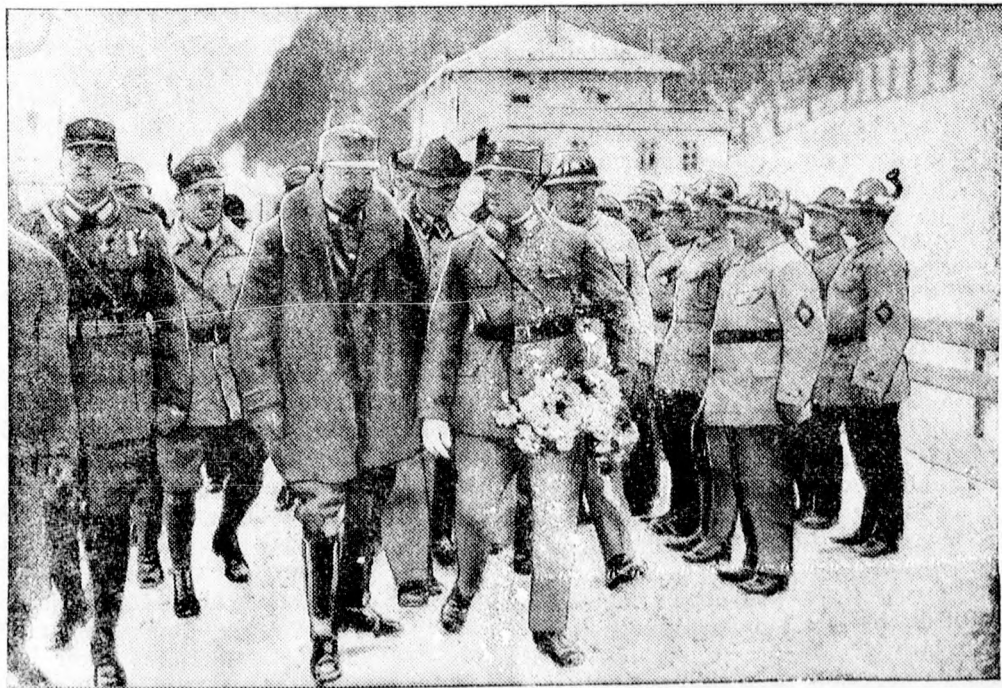
PABST ŐRNAGY VISSZATÉRT AUSZTRIÁBA

A jó idő ellenére is gyengén sikerült a szentai vásár. Szentáról jelentik: A vásárrnap Szentán megtartott országos vásár a jó idő ellenére sem mondható sikerültnek. Rengeteg árut hoztak fel, azonban a nehéz gazdasági helyzet miatt a kereslet minimális volt. Az állatvásáron némi élénkség mutatkozott, két kereskedő nagyobb mennyiségű állatot vásárolt és szállított Milanoba. A szentai vásáron mintegy 439 állat cserélt gazdát.