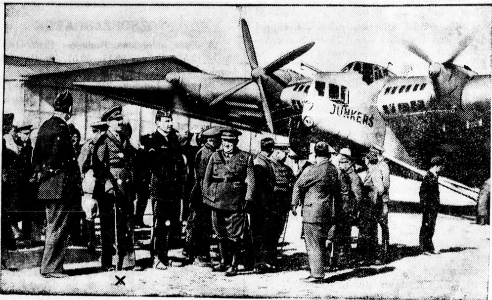
A SPANYOL KIRÁLY MEGTEKINTI A G 38 NEVU NEMET ORIÁSGEPET

egy Bostonba induló repülőgépre és a rendeltetési állomáson egy barátja fizette ki az utánvételes „csomag“ szállítási költségeit.