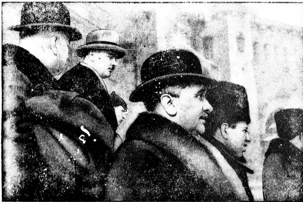
Német delegáció Moszkvában