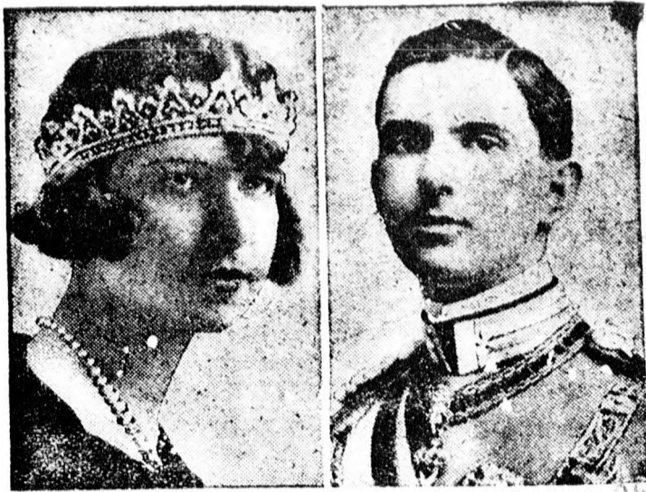
Umberto olasz trónörökös és felesége.

akikről a párisi lapok azt írják, hogy válni akarnak. A trónörökös pár egy évvel ezelőtt kötött házasságot.