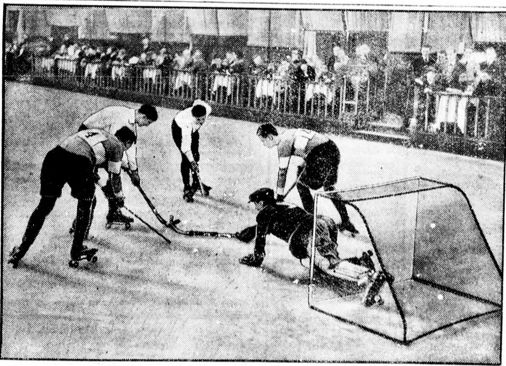
A legújabb sport: Hockey kerekescorolyán