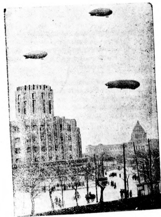
Léghajók a japán főváros felett