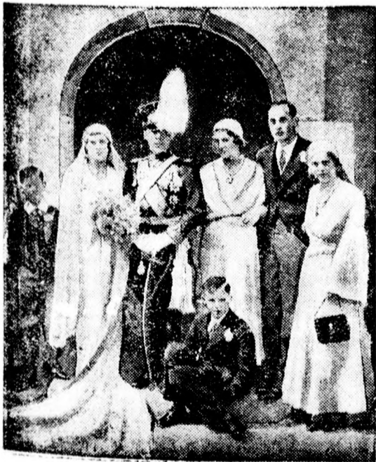
Margaréta görög hercegnő és Hohenlohe-Langenburg herceg, Langenburg kastélyban házasságot kötöttek.

A rejtélyes és bámulatos ügyes fegyvergyártót mindeddig nem sikerült kinyomozni.