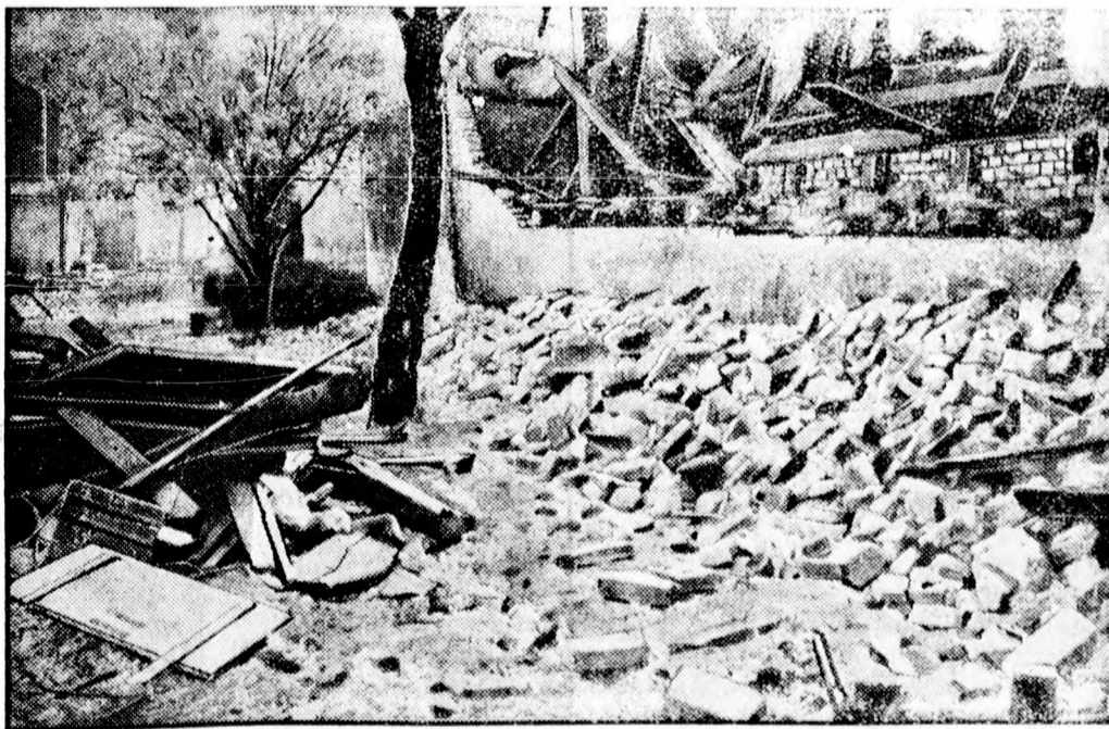
A múlt hétén nagy vihar pusztított Belgiumban, amely nagy károkat okozott.