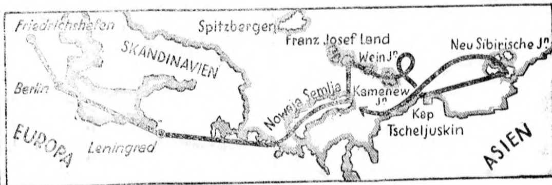
A Graf Zeppelin tervbevett északsarki útjának utvonala.