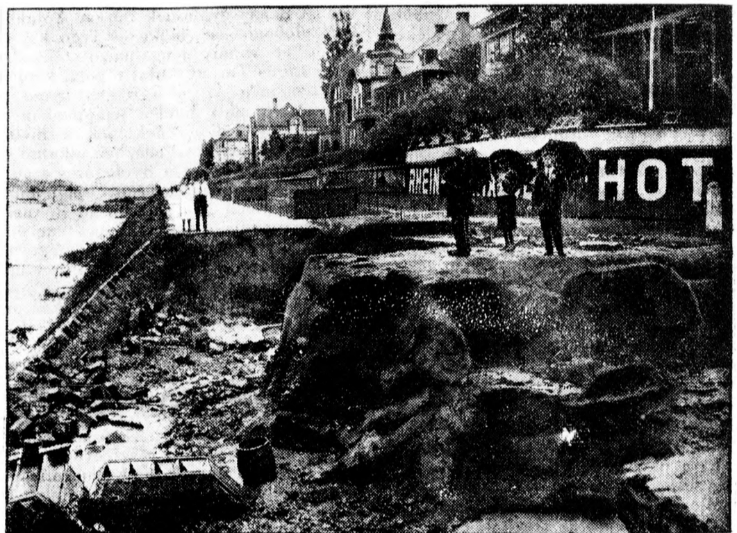
Az elmúlt napokban a Rajna mentén óriási orkán dühöngött, amelyet teljesen tönkretett a vihar. Képünkön Mehlem fürdőhely partját mutatjuk be, amelyet teljesen tönkretett a vihar.

Délután sportünnepségek lesznek és a becskerek-i közönség ez alkalommal jelentkezhet a repülőgépen egy-egy körrepülésre a város felett. Egy utára ötven dinár lesz. Este nyolc órakor a becskerek-i zenekarok és dalárdák nagy ingyenes hangversenyt rendeznek a főtéren.