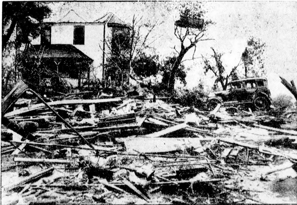
Az amerikai Eureka városát teljesen elpusztította a tornádó. Képünk az elpusztult város egy részletét mutatja.