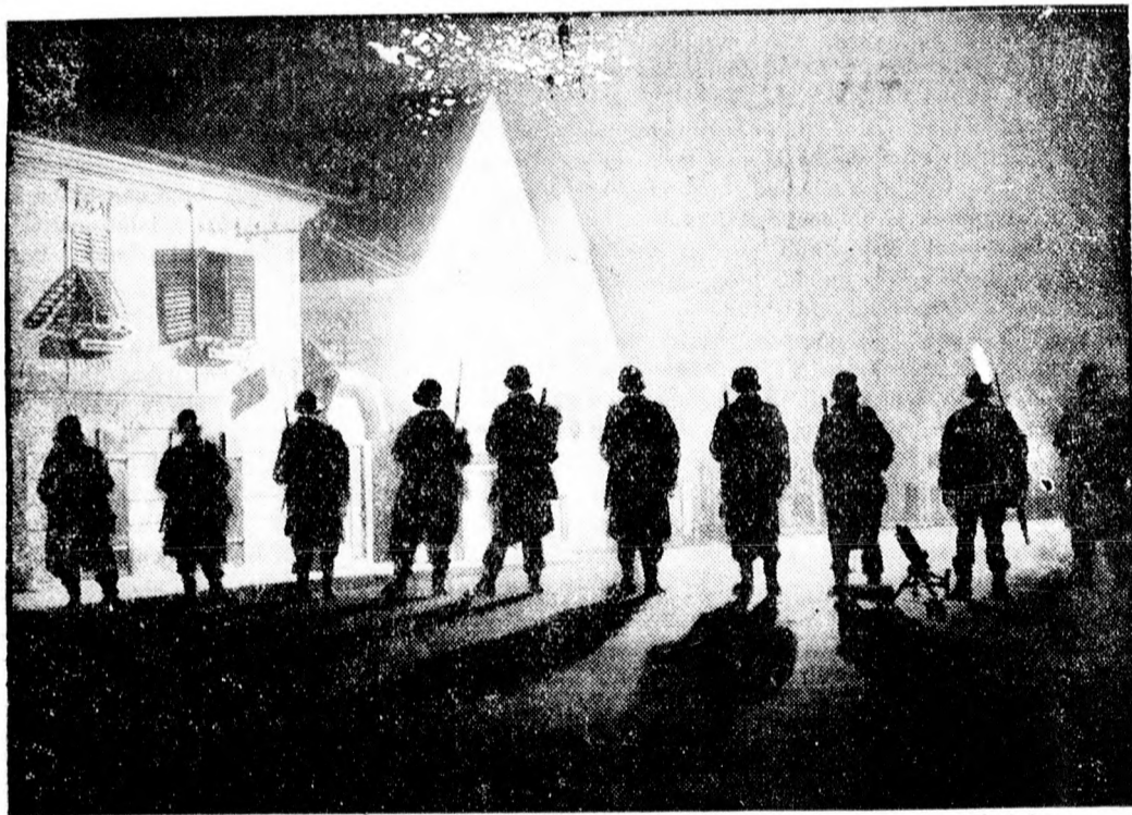
A stájerországi Heimwehr múlt vasár napi pucskísérlete után erős katonai járőrök cirkálnak a Heimwehr főszékhelyében.