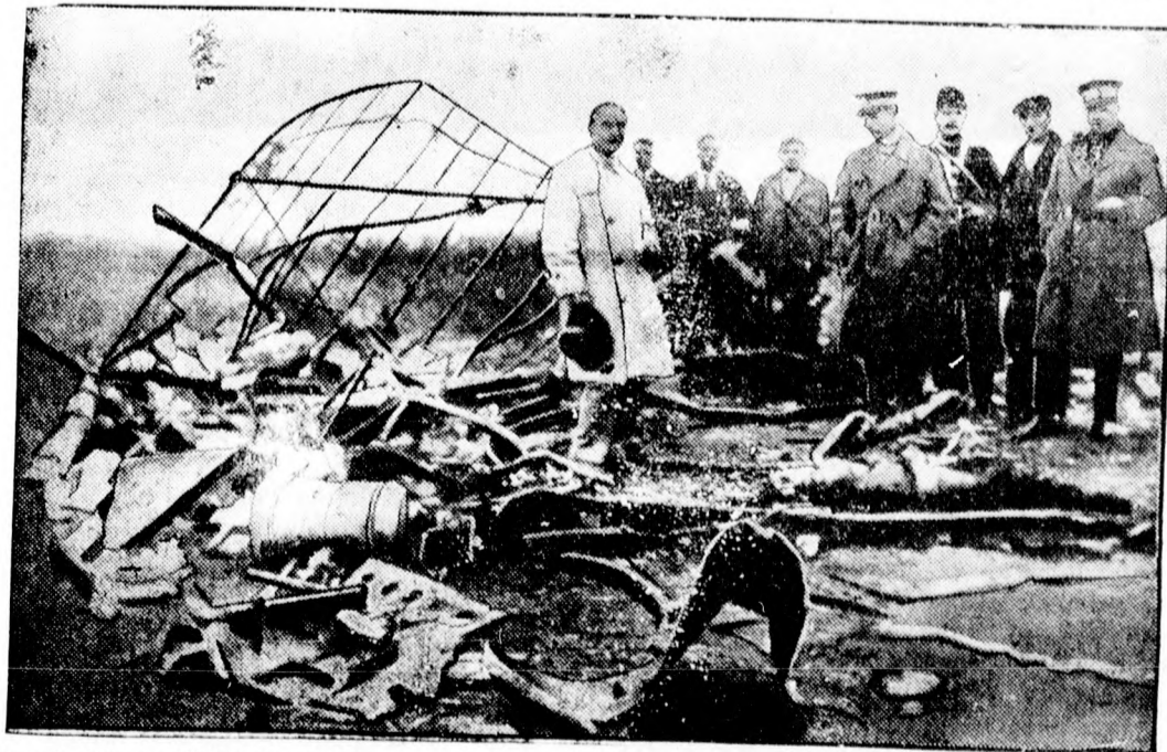
A romániai repülőkatasztrófa