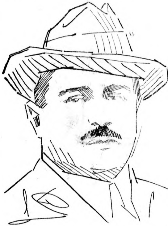
gaival. Így Zsivkovics Petar miniszterelnök listája mellett adta le szavazatát az ország választóinak óriási többsége.

Beogradban a választók hatvan százaléka élt szavazati jogával. Különösen erős volt a választók felvonulása Ljubljánban, ahol szintén sokkal többen szavaztak, mint a legutóbbi képviselőválasztások alkalmával. A szávi bánáság hatvan járása közül 56 járásban volt ötven százaléknál magasabb a választók felvonulása, sok járásban, a 60-70 százalékot is elérte, a grasaci és donji lapaci járásban pedig a választók nyolcvan százaléka élt polgári jo-