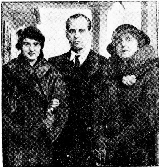
Mária román anyakirályné Münchenben

Az új 6 hetes tánckurzus pénteken, 20-án este veszi kezdetét, tandíj 120 Din. Szombaton, 21-én Zárótűzérke este 9-től 9-ig. Vizsga táncok.