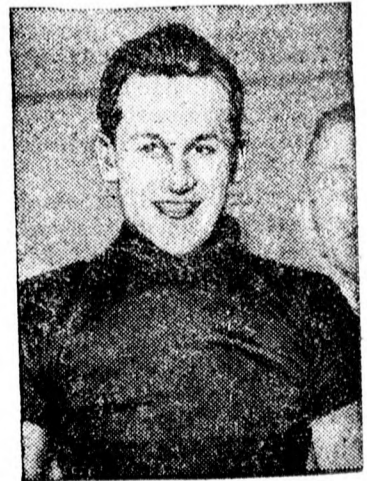
A csikógói hatnapos kerékpárverseny győztese

Pancevó: Bánát—PSK 2:1 (0:1). Bajnoki. Biró Podgradzki. Szépszámú néző előtt zajlott le Pancevón az utolsó őszi bajnoki mérkőzés, mely a várt Bánát-győzelemmel végződött. A játék igen élénk és változatos volt. Az első félidőben a PSK volt jobb, de fiatal tartalékjátékosai nem bírták az iramot. A második félidőben a játék képe teljesen megváltozik és a Bánát kerül állandó fölénybe, de csatárai a legérettebb akciókat sem voltak képesek kihasználni. A PSK az utolsó reményét is elvesztette az első osztályban való maradásra és most már valószínű, hogy a jövő bajnoki szezonban másodosztályú csapatok társaságában fog küzdeni. A mérkőzést Podgradzki becskeréki bíró több hibával vezette.