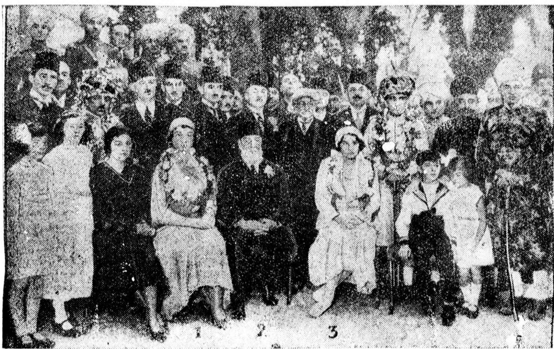
A világ leggazdagabb emberének gyermekei megházasodtak

Ezenkívül, mint már azt jelentettük is, a limáni uccák kövezésére 3 millió 935.508 dinárt szavazott meg a költségvetés. Nagyon fontos lesz az új iskolák építése és bár a jövő évi iskolai építkezésekkel még nem lehet végleg kiküszöbölni az elemi iskolákban a helyszűke miatt mutatkozó anomáliákat, az előirányzott 2.800.000 dinárból még is annyi tantermet lehet építeni, amelyek e térben is alkalmasak a helyzet javítására. A nagyobb investíciók között szerepel a Rókus patak szabályozására előirányzott 350 ezer 340 dinár továbbá az 1931. évben elkezdett de be nem fejezett munkák kiadásának fedezésére szolgáló 1.400.000 dinár.