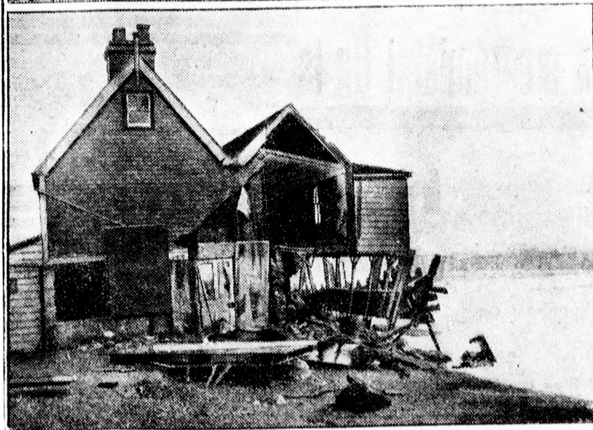
A La Manche csatorna mentén borzalmas vihar dühöngött, amely Délanglia partvidékén nagy pusztításokat okozott.