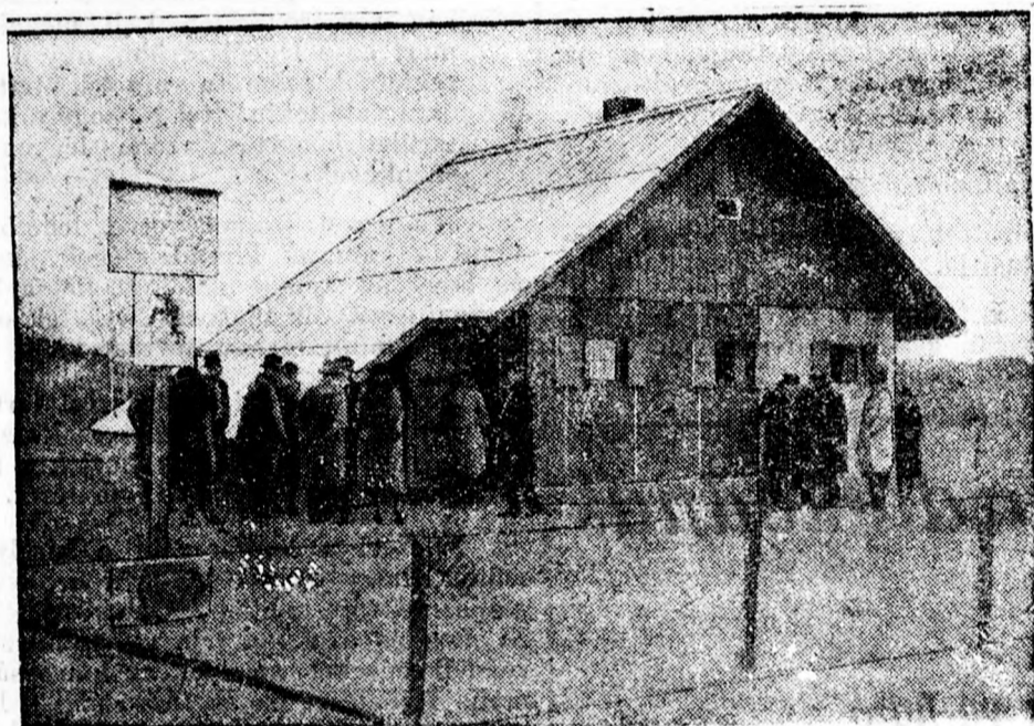
Ezt a házat tíz nap alatt építették fel zekből építette ezt a házat a munkanélküliek telepén. A házat tíz nap alatt állítják össze acéllemezekből. A német pénzügyminiszterium acélleme-