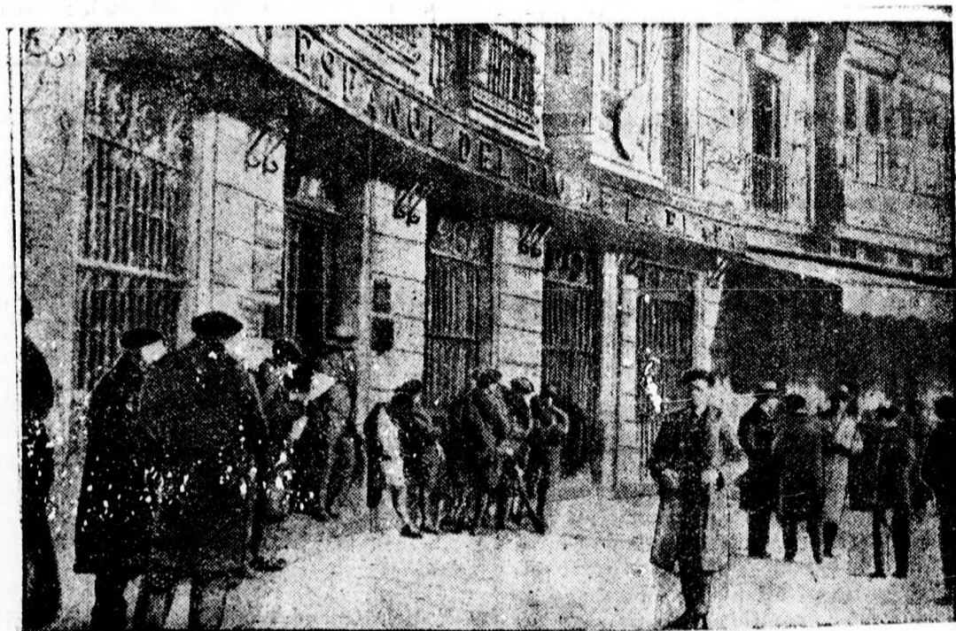
A bilbaoi forrongások: Rendőrség őríz egy bankot a kommunisták elől.