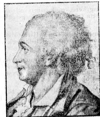
Kétszáz év előtt született a „Figaro lakodalma“ írója