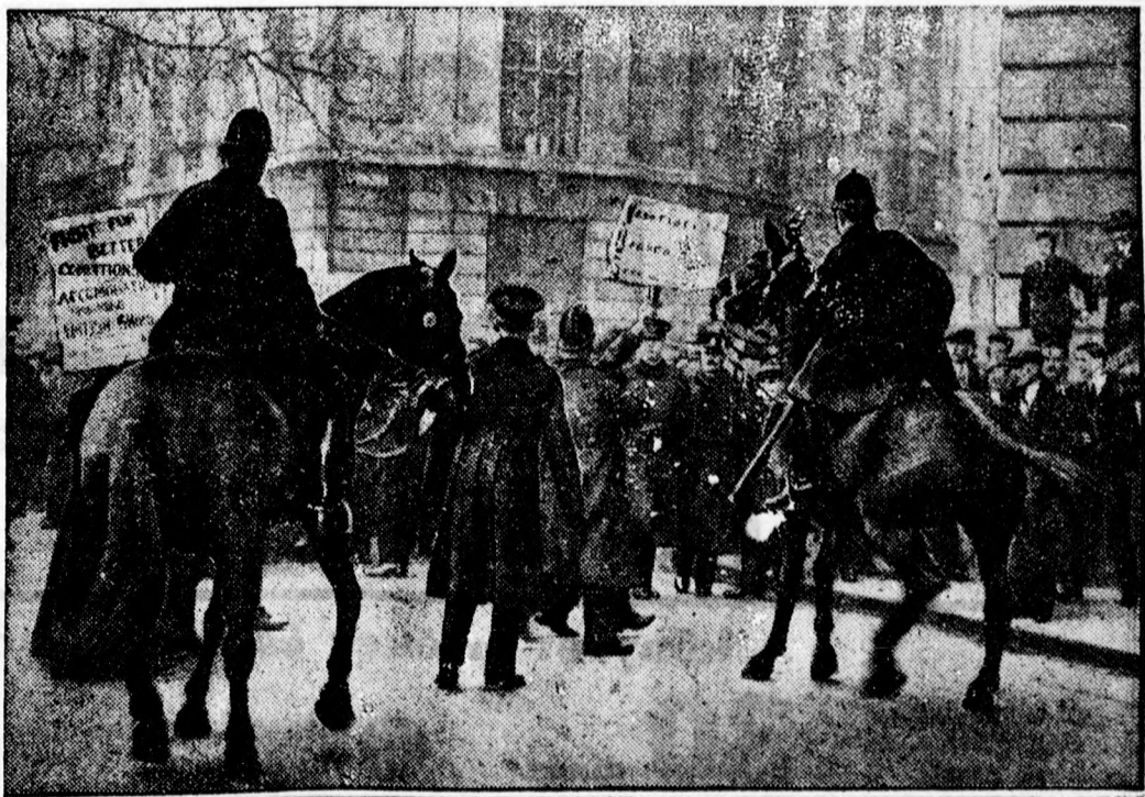
A londoni Rendőrség szétosztatja a tüntető kikötőmunkások csoportját.