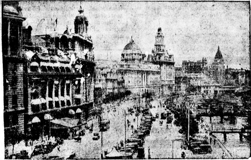
Sanghai európai negyede