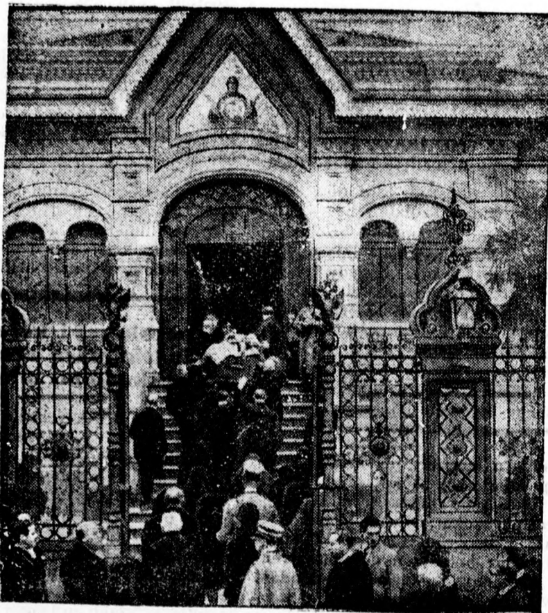
A volt görög királyné temetése

Prága. 11: Gramofon. 5.05: Ondrzsicsek-négyes. 7.20: Sospisil I. dalestje. 8.05: Fuvószena. 10.15: Rádió- és színházi hírek. 10.20: Mai zeneművek.