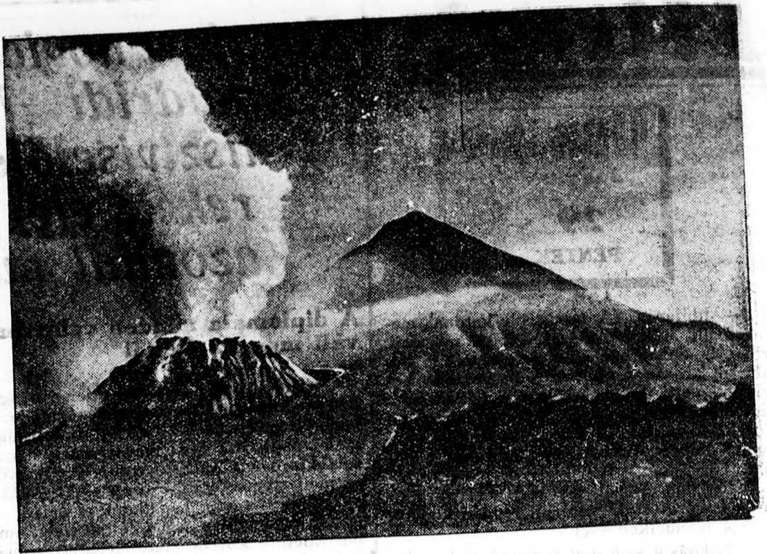
Az egyik tűzhányó működés közben. (Repülőgép-felvétel).