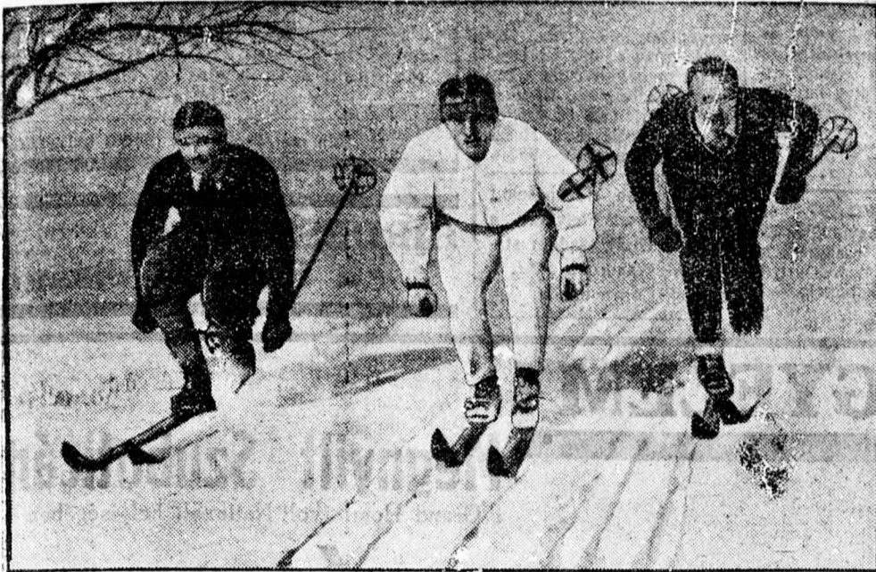
Világ bajnokjelöltek tréningje a téli olimpiász előtt

bori alszövetség él és dolgozik, amit az is mutat, hogy a most Prágában szereplő csapat diákjátékosai részére a közoktatásügyi minisztériumtól a résztvételi engedélyt ép a szombori alszövetség szerezte meg s a csapatot a szombori alszövetség egyik funkcionárusa kísérte Prágába.