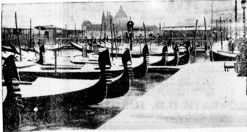
A februári tél Olaszországot sem kímélte meg és a velencei San Marco rakpartot hólepel borítja.

Az értekezlet délután öt órakor ért véget.