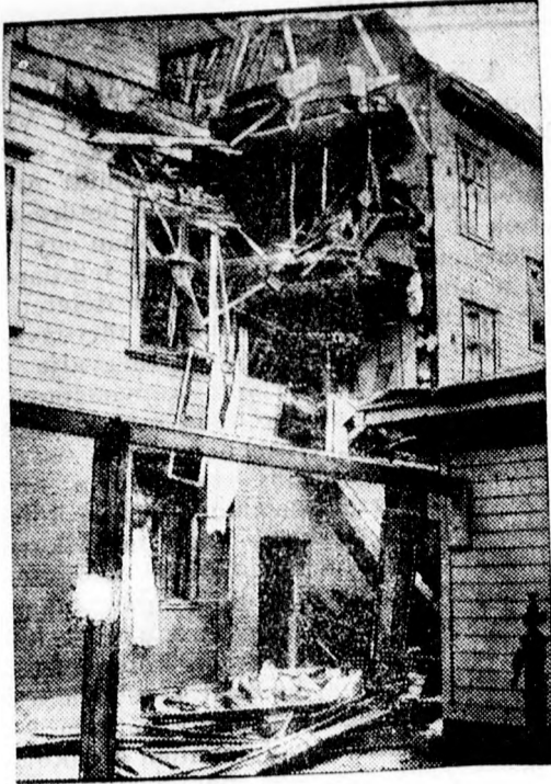
Bosszúból felrobbantottak egy házat