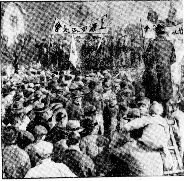
Baloldalt: Népszónok buzdítja a kínaiakat a háborúra. Jobboldalt: Hábórus tüntetés Sanghai utcáin

Sanghaiból jelentik: A városban és környékén vasárnap változatlan hevességgel tombolt a harc. A hétfői nap heves tüzérségi párbajjal kezdődött. A kínaiak nehéz ágyut kaptak és célzási biztosságuk is javult valamivel. Egy kínai ágyulövedék az egyik japán hadihajót érte, megsebesítette a kapitányt és a legénység tiz tagját, a hajót pedig megrongálta. A japánok támadásait a sűrű köd és a szüntelen zuhogó zápor megnehezíti.