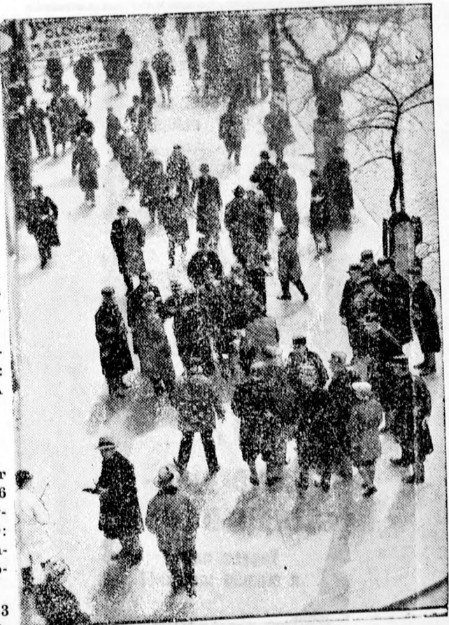
Eredeti felvétel a multheti budapesti sztrájkokról