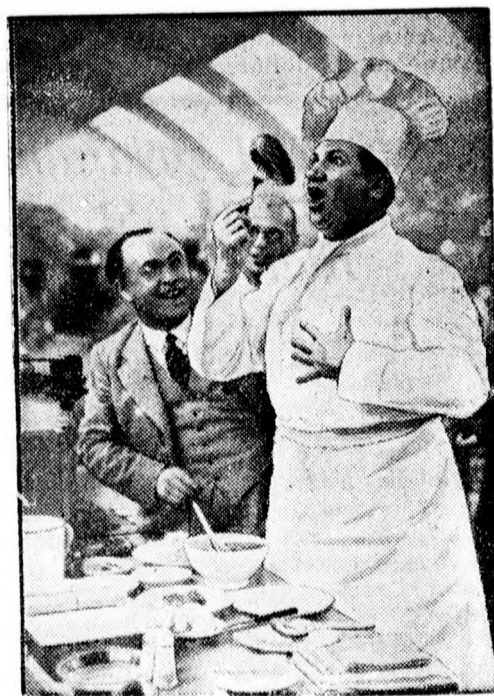
Fritz Kampers német filmszínész, a berlini színészek főzőversenyén