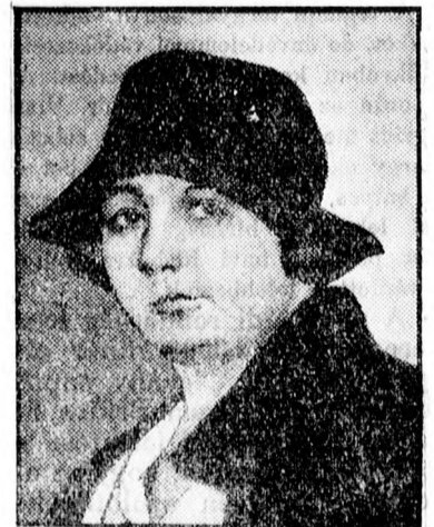
Hanau asszonyt újból letartóztatták

lékra, a többi értékpapírok lombard kamatlábát 7.5 százalékról 7 százalékra szállította le.