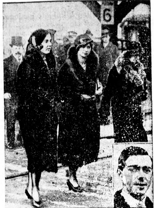
Gusztáv Adolf svéd trónörökös édesatyja születésnapján, július 16-án eljegyzi Sybille szász-köburg gothai hercegnőt. Képünkön jobb sarokban a svéd trónörökös, fenn középen a Stockholmba érkező Sybille hercegnő.

Ezek a tervek ma még kezdetleges stádiumban vannak, de a közeli napokban kezdődő megbeszéléseken hamarosan kidolgozzák és újabb rövid idő alatt meg is valósítják azokat. A nagy bankok akciójához csatlakozni óhajtanak kisebb pénzintézetek is, amelyek részére kevésbé költséges berendezést igénylő védekezési módszert fognak kitervelni.