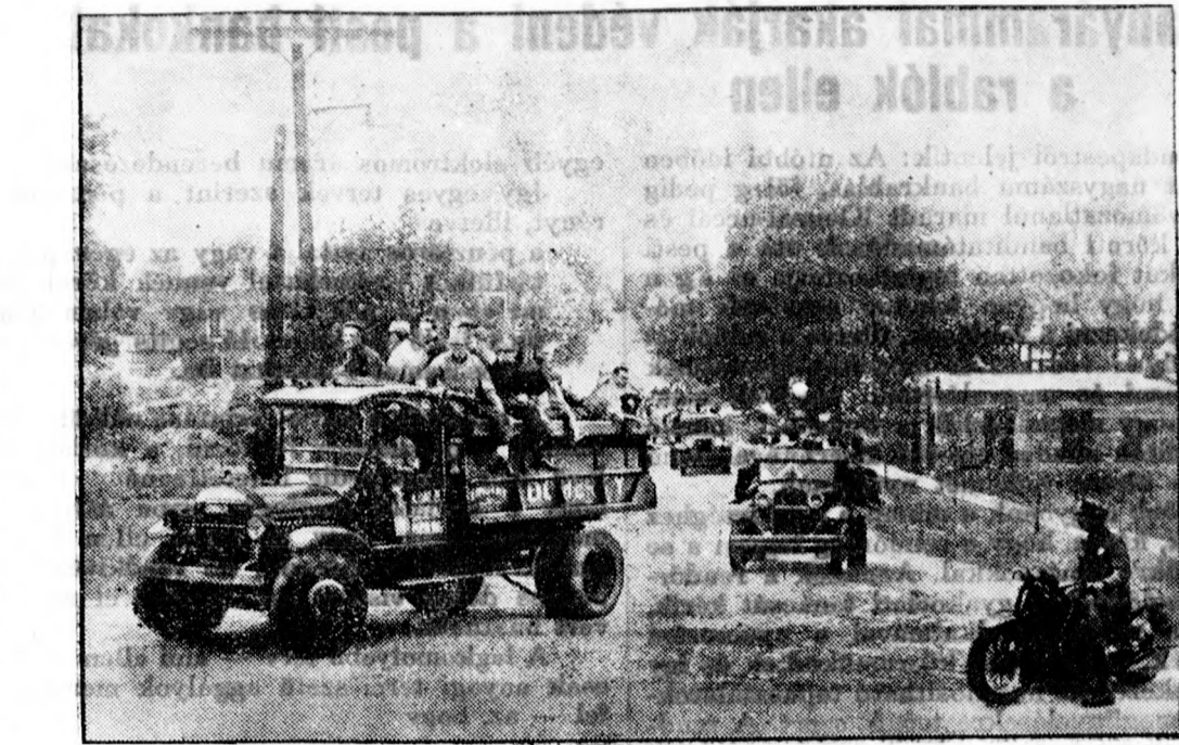
Felvonu'nak a munkanélküli amerikai froutharcosok

Szombori terménytőzsde. Bácskai buza szombori 130—132, felsőbácskai 130—132, szerémi buza és szlavóniai 130—132, tiszai hajórakomány bácskai 131—133, bánati 130—132, zab bácskai vasut 145—150, zab szerémi 147.50—152.50, árpa bácskai 140—145, tavaszi bácskai 157.50—162.50, bab usans 230