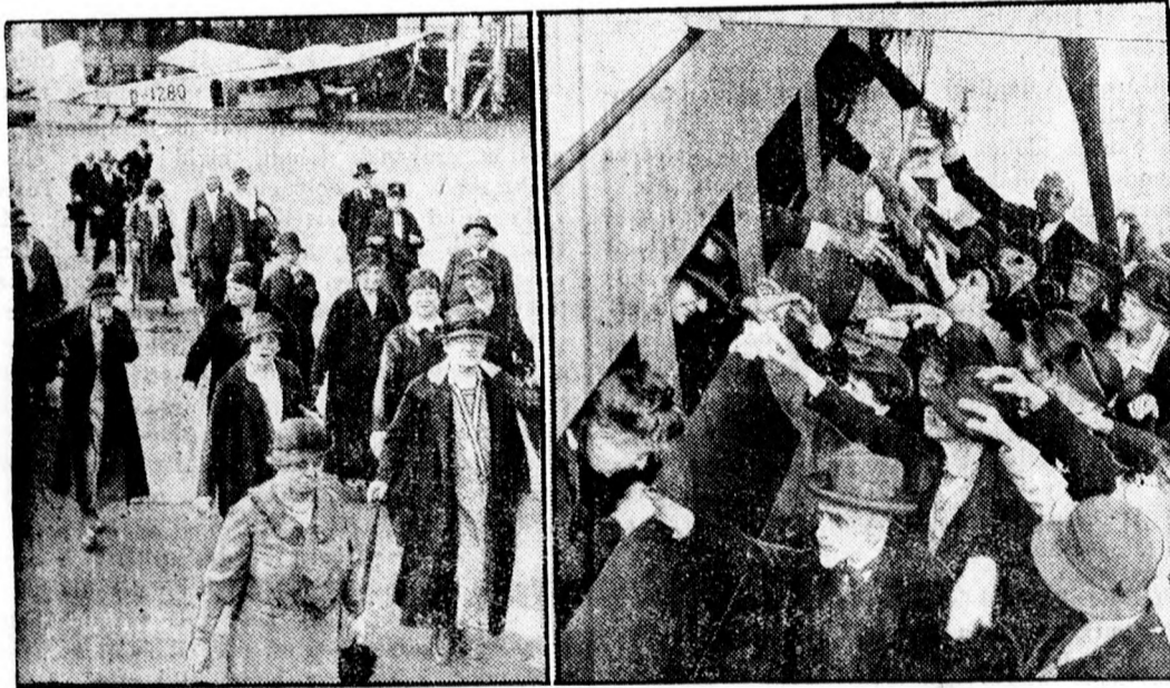
A berlini Lufthansa az elmúlt vasárnap ingyenes repülést rendezett olyan öreg emberek részére, akik még nem ültek repülőgépen. Az utasok között sok 80 esztendőn túl levő ember is akadt. Baloldali képünk: az idős utasok felvonulása a starthoz. Jobbra: bucsu a gép indulása előtt.

A magyar üggető Derbyt (díj 5200 pengő, távja 3200 méter) a Hollán istálló Nevadian nevű 4 éves ménje nyerte, második a pusztaberényi ménes Németh Mária-ja, harmadik a Hansa istálló Nagy Péterje lett. Futott még három ló.