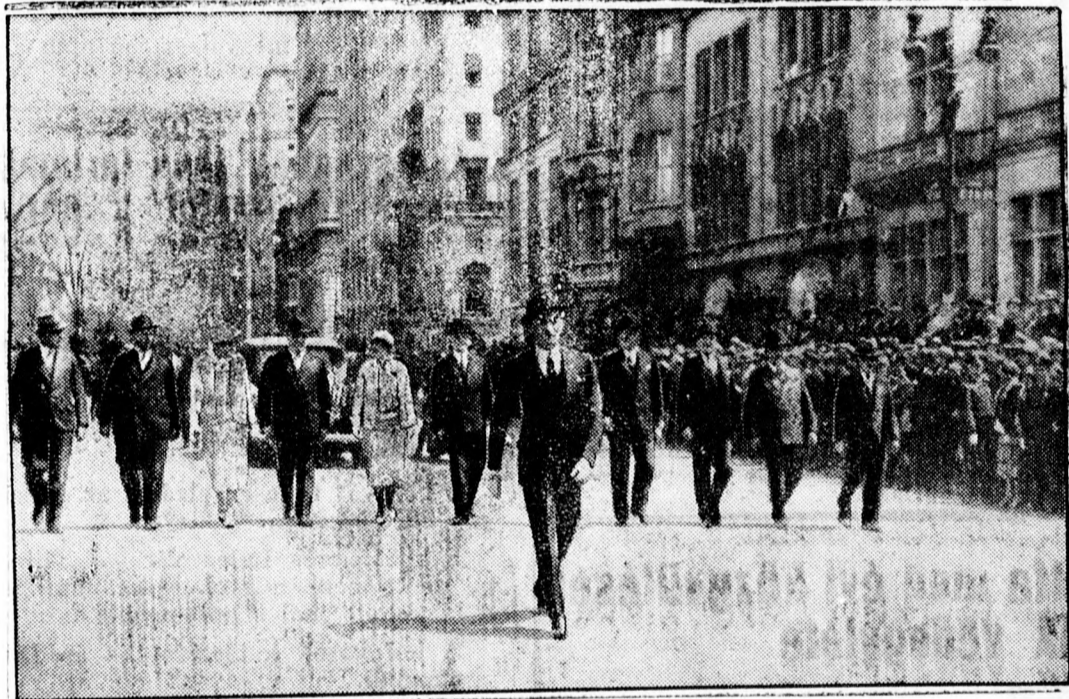
Megvesztegetéssel vádolják a newyorki főpolgármestert

Szükséges a csövek átméretezése és a hálózat kibővítése. Mindezt az új vízvezeték osztálynak kell elvégeznie. Az új osztályt, miután közgyűlés döntött létesítése mellett, legrövidebb időn belül felállítja a városi tanács.