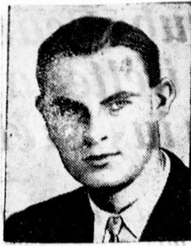
Az örült anyagilkos

— Füzöket, melltartókat méret szerint legolcsóbban készít: Fischer és Fia, Noviszád.