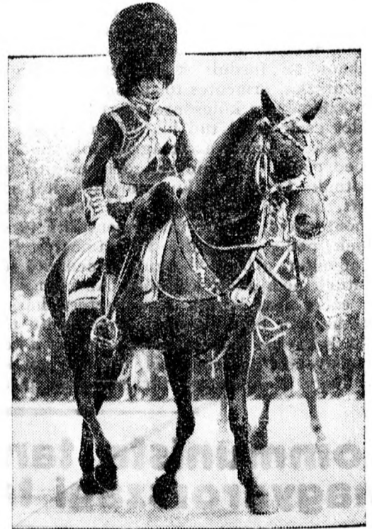
V. György angol király, 400 millió ember uralkodója, 67. születésnapján a testőrezredek diszfelvonulásán.