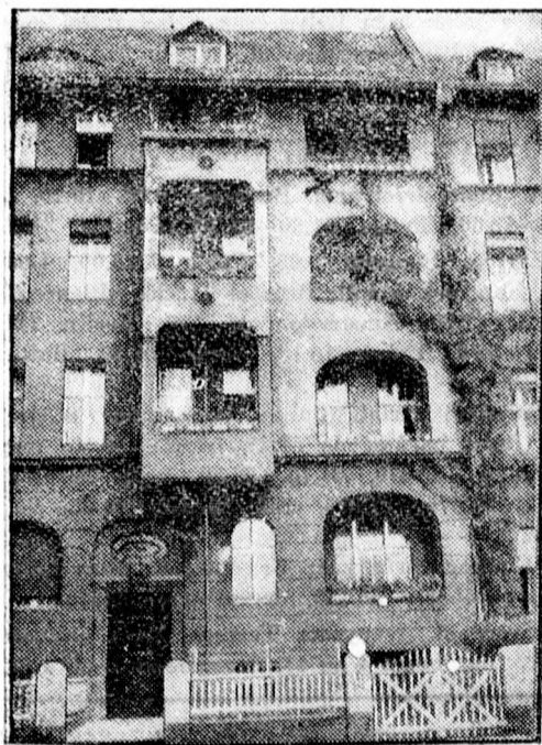
A berlini hamispénzgyár.

A frontharcosok meghátrálásáról csak abban az esetben lehet szó, ha a kongresszus megszavazza a két millió dollárt, mellyel munkához juttatná a nélkülöző frontarcosokat.