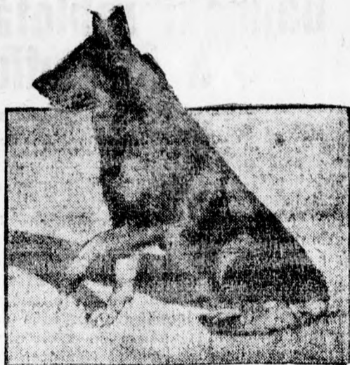
— Pün Tin Tin, a mozikközönség kedvenc kutyája, amely a múlt héten filmfelvétel közben 14 éves korában elpusztult.

— „Ferenc József” keserűvíz a makacs székszorulás mindenféle jelenségeinél a legjobb szolgálatot teszi.