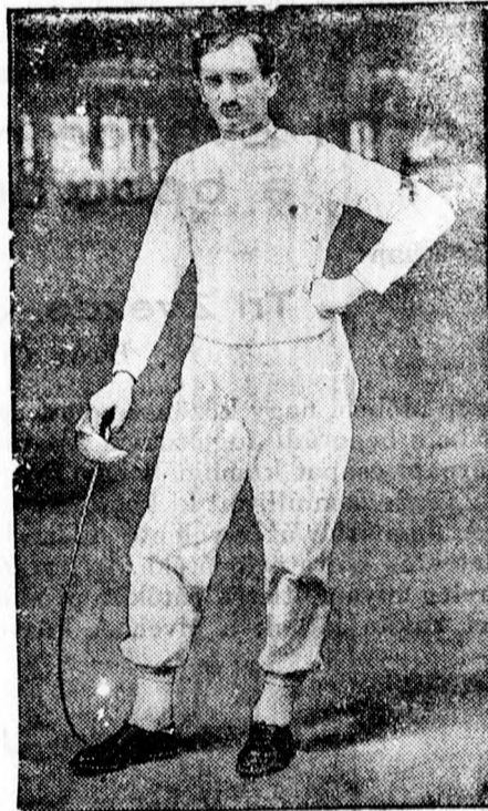
A szubotica szarmazasu

Vasárnap a bácsi Omladina a német serlegért játszott mérkőzések során Parabucson szerepelt és 1:1 arányú eldöntetlen eredményt ért el. Hétfőn a palánkai Szloga csapata játszott propaganda mérkőzést, mely az Omladina FC 1:0 arányú megérdemelt győzelmévé végződött. — A parabucsi eldöntetlen meccs után az Omladina a német serlegmérkőzéseken megtartotta első helyezését 5 ponttal és 9:1 gólaránnyal. Szóval a serlegmérkőzés első felében nagy előnye van a többiekkel szemben, úgy hogy a serlegre jogosan aspirál.