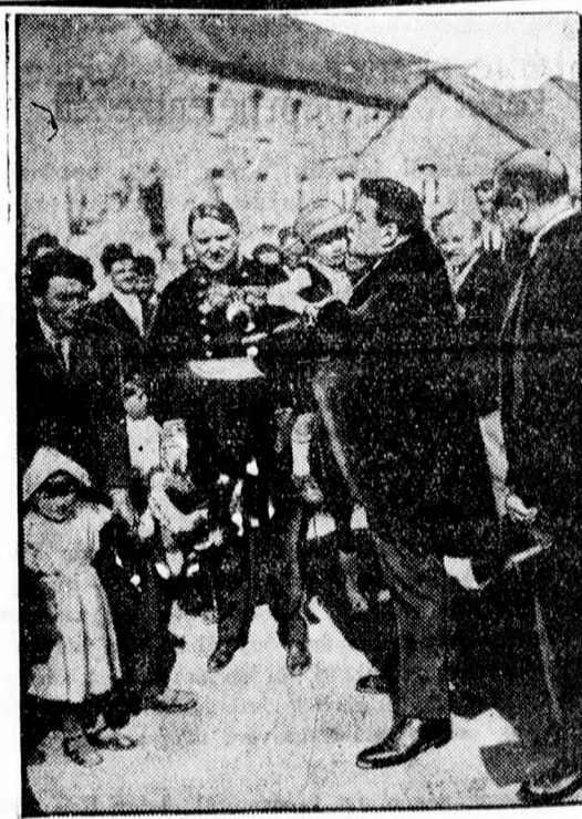
Herriot üdvözlése a Rennes-i ünnepen. A Bretagne és Franciaország egyesülésének negyvenedik évfordulóján rendezett ünnepen Rennesben felrobbantották az egyesülést jelképező emlékművet. Herriot miniszterelnök a robbanás után érkezett meg Rennesbe, ahol nagy ünnepélyességgel fogadták. Képünk azt a jelenetet mutatja, amikor Herriot megcsókolja az öt üdvözlő kisleányt.