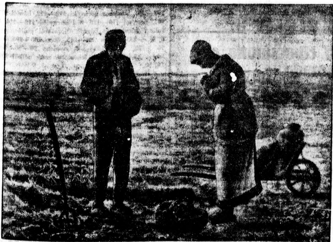
Millet „Angelus” című világhírű festményét, a párisi Louvreból egy elmebajos mérnök borotvával több helyen megsértette.

A noviszádi iparosgyesület részéről az egyes lapokban megjelenő hírekkel kapcsolatban annak közlésére kértük fel bennünket, hogy alaptalanok azok a hírestelések, mintha az önálló iparoskamara rendszer az