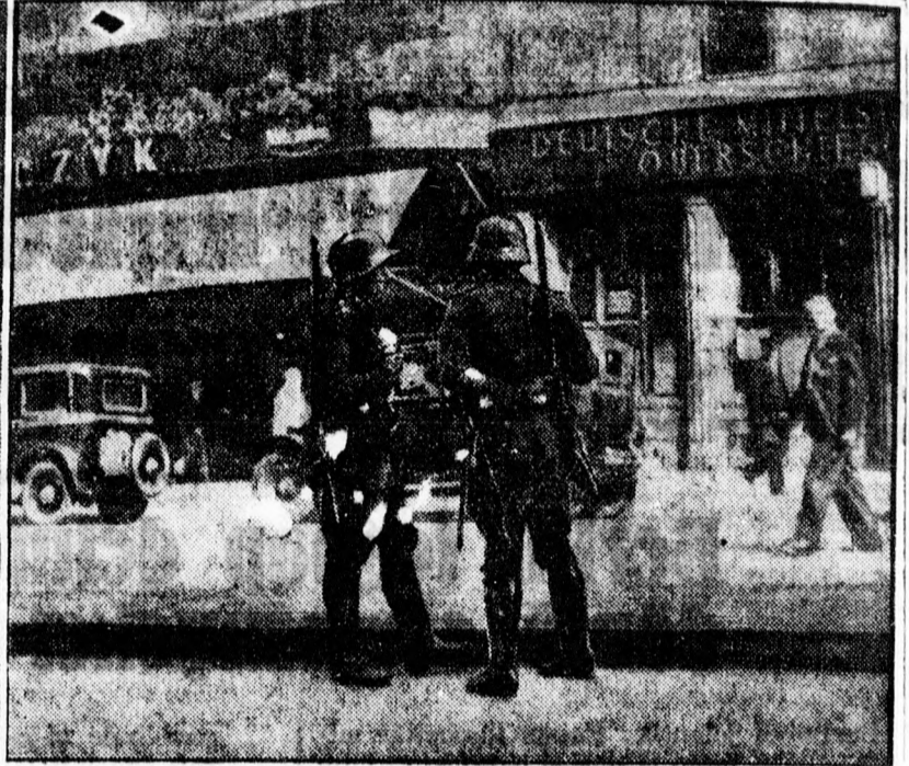
ros rendőrsége állandó erős készenlétben van. Baloldali képünk a beutheni fogház ka-