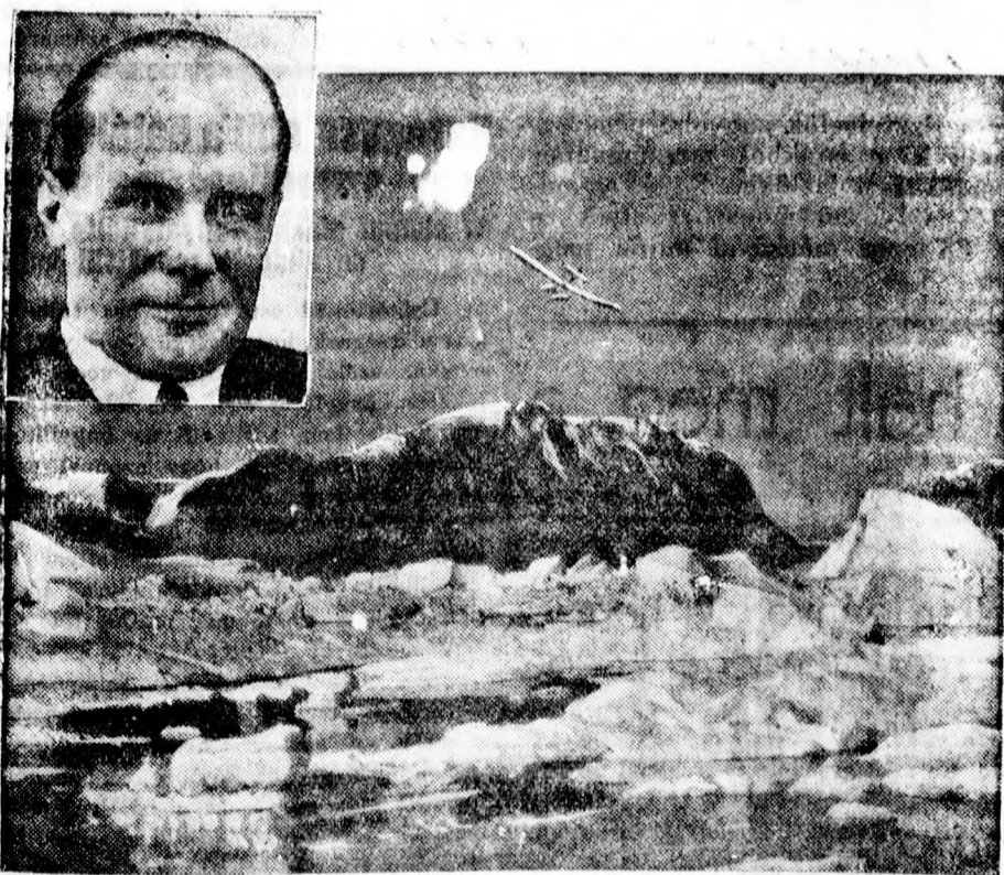
Ernst Udetről a Grönland felett eltűnt repülőőről még mindig semmi hír és kutatói most már bizonyosra veszik, hogy a bátor pilóta halálát leltek Grönland gleccservilágában. Baloldalon fenn: az

November 15-én este fáklyás menet lesz a város főbb utvonalaín az összes egyesületek részvételével. November 16-án a vidéki vendégek és felsőbb hatóságok kiküldötteinek ünnepélyes fogadtatása, a felekezetek hálaadóistentisztelete, majd nagyszabású leleplezési ünnepség a szobornál, rossz idő esetén a közgyűlési teremben diszkozyülés, déliban bankett. Délután néppünnpély, este pedig az összes kultüregyesületek rendezésében kultürest és mulatság. A program részletes kidolgozására és megrendezésére egy szükobbkörü bizottságot küldtek ki.