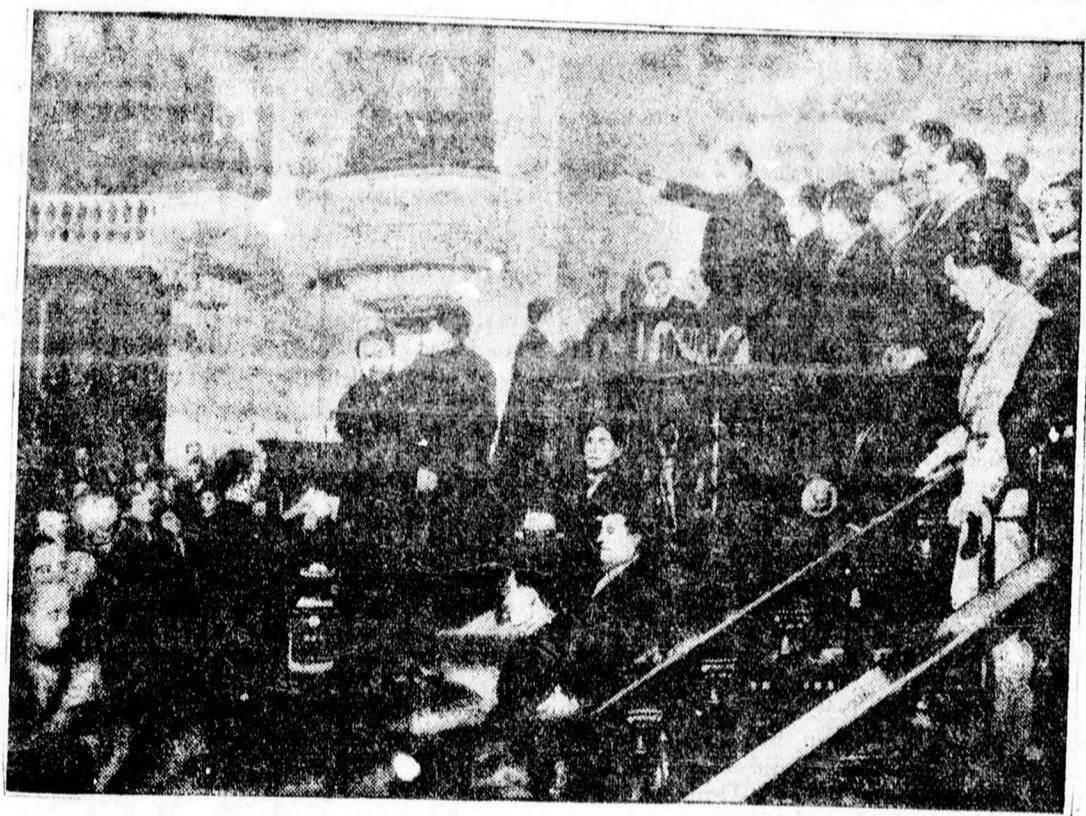
Mexikó új elnöke felelősül az alkotmányra

Vannak megértőbb anyósok is. Egy anyós például a leghatározottabb formában ajánlja sorstársainak, hogy a fiatalok életébe ne avatkozzanak s biztosítsák részükre a legteljesebb függetlenséget. A beavatkozás — írja — mindig veszéllyel jár, mert nincs olyan anyós a világon, aki a legjobb és legkedvesebb leányt is méltónak tartaná fiához. Sok-sok válaszból megállapítható, hogy többnyire a férj anyja elégedetlen, viszont a feleség anyja már jobban meg tud barátkozni az új helyzettel. Az utóbbi kategóriába tartozó anyósok közül nem egy írja: Boldog vagyok, mert a leányom kitart mellettem, de a vőm is derék, jóra való ember, aki mindenben igyekszik kedvemben járni. Mint a körkérdés egymásnak ellentmondó eredményeiből kitűnik, az anyóskérdés az angol családoknál is akut probléma, mint ahogy az volt és lesz minden időben és a világ minden táján.