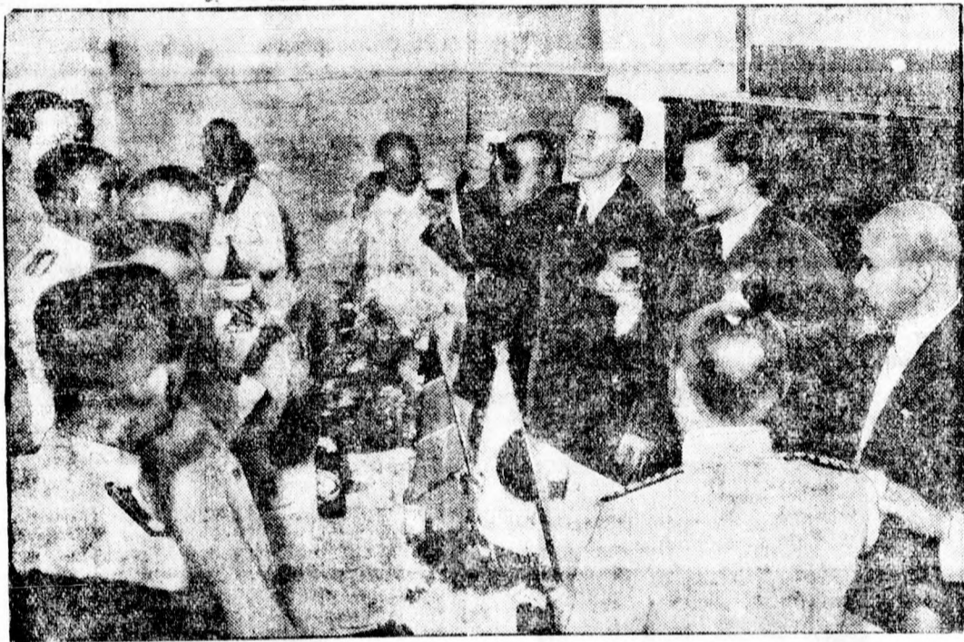
A világrepülő Gronau fogadtatása Japánban. Gronau német pilótát földkörüli repülése során Japánban a japán tengerésztisztek vacsora keretében ünnepelték.

A vakmerő támadás ugyszólván pillanatok alatt folyt le és mire a bankszolgák és az ucca népe észbe kapott, a banditák már messze jártak. A rendőrség erélyesen nyomoz utánuk.