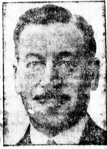
MacDonald és a lemondott Sir Herbert Samuel

Londonból jelentik: Az ottavai konfe- rencián létrejött egyezmény miatt támadt Románnyal kapcsolatban részben megoldódott. A li- berális képviselők egy része Sir Herbert Samuel belügyminiszterrel ellenzékbe vonult, a többiek Simon külügyminiszter veze- tésével továbbra is támogatják a nemzeti egység kormányát.