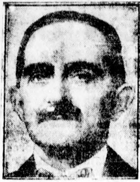
Politikus görög delegátus a Népszövetség teljes ülésének ezévi elnöke.