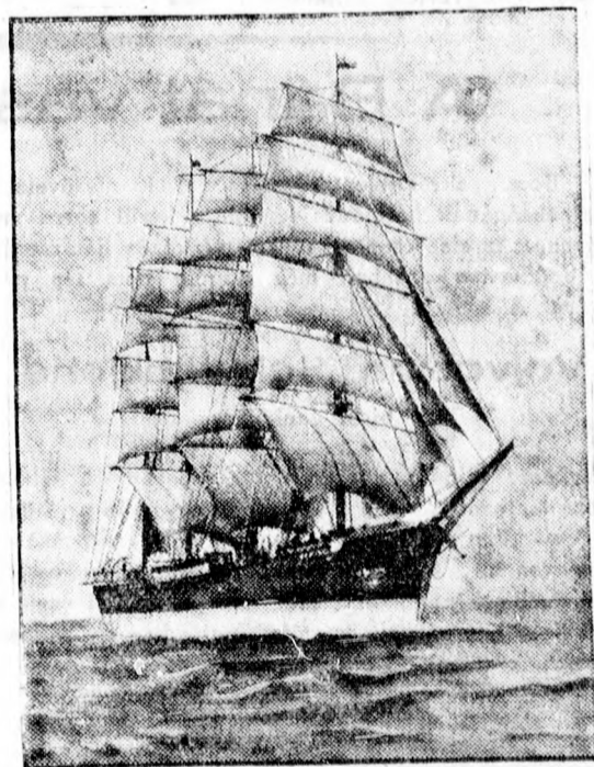
Pusztuló romantika. A „Peking” négy árbócos, amelyet Anglia vett meg iskolahajó céljaira Németországtól. Az egész német tengerészetben már csak két árbócos hajó marad.

(MAK) Berlinből jelentik: Érdekes összeállítást közöl Prof. Dr. H. Stegen (Göttingen) az európai lótenyésztés fejlődéséről a háboru utáni években. Németország lóállománya az utolsó békeévben 4.5 millió darabot tett ki, mely a háboru alatt 25 százalékkal esett vissza. 1924-ben a létszám már ismét elérte a békenívót. Franciaország lóállománya ellenben még mindig lényegesen alatta marad a békelétszámnak, mely 3.3 millió darabot tett ki. Azóta fokozatos emelkedéssel a létszám 1930-ig 2.9 millió darabra emelkedett, ugyanannyira, mint amennyi 1900-ban volt. A háboru alatt az állomány 1 millió darabra csökkent. Belgium lóállománya az elmúlt 40 év alatt alig mutat lényeges változást és az 1900. évi 241 ezerrel szemben a múlt évben 242 ezer darabot számláltak. Legnagyobb volt a létszám 1927-ben, 256 ezer, szemben az 1913. évi 267 ezer darabbal, mely a háboru alatt 161 ezerre esett. Hollandiának 1910-ben 327 ezer darab volt az állománya, mely 1930-ig 296 ezerre csökkent. Az angol lóállomány szintén csökkenő tendenciát mutat. 1900-ban még 1,150,000 darab volt, 1913-ban pedig 1,240,000 darab, mely 1931-ben 938,000-re csökkent. Dánia 1914. évi 567 ezer darabos állománya 1929-ig 521,000 darabra esett. A svéd lóállomány az 1915. évi 671 ezer darabról 620 ezerre csökkent. Legnagyobb létszámát pedig 1920-ban érte el, 728 ezer darabot. Finnország lóállománya végül az 1920. évi 384 ezer darabról 1927-ig 396 ezerre emelkedett, kulminációs pontját 1924-ben érte el, 403 ezer darabbal.