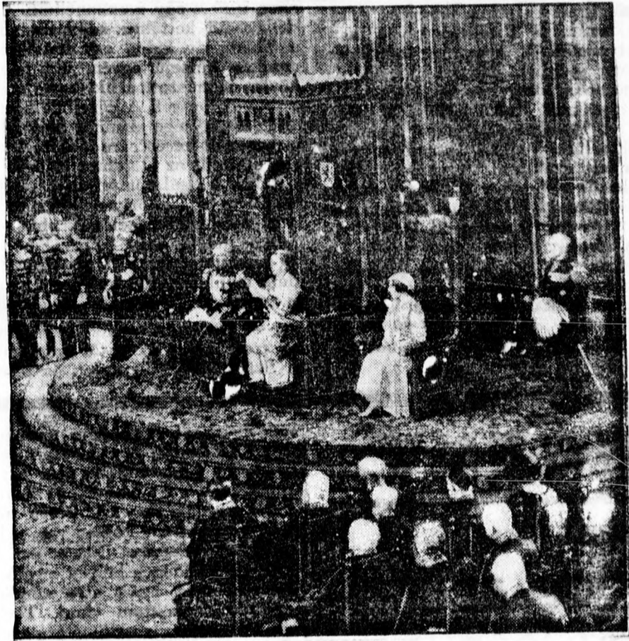
Vilma holland királynő felolvassa a trónbeszédet a holland parlament megnyitása alkalmából.

a legtöbb kilenc hónapban. A statisztika részletes kimutatást közöl arról is, hogy a halálos áldozatok melyik párthoz tartoztak és mi volt a foglalkozásuk.