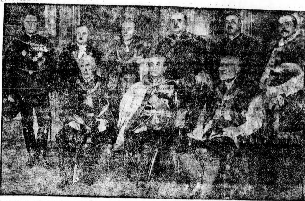
Az új magyar kormány

Gazdasági, pénzügyi, szociálpolitikai reformokat jelentett be az új miniszterelnök