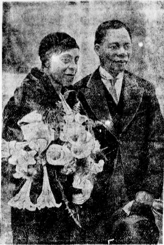
Exotikus esküvő Párisban

— LYSOFORM A LEGIDEÁLISABB FERTŐTLENÍTŐSZER!