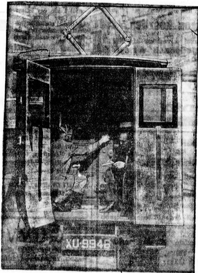
London harca a rádiókalózzal

ápolatja arcát. Mindennemű szépséghibák rendbehozatala mérsékelt árak mellett. Olcsó bérlet. Próbálja ki „Róza” arckrémét, pudert és ruzst. Tegyen próbát. Tanácsadás díjtalan. Noviszád, Trg Oslobodjenja 3. II.