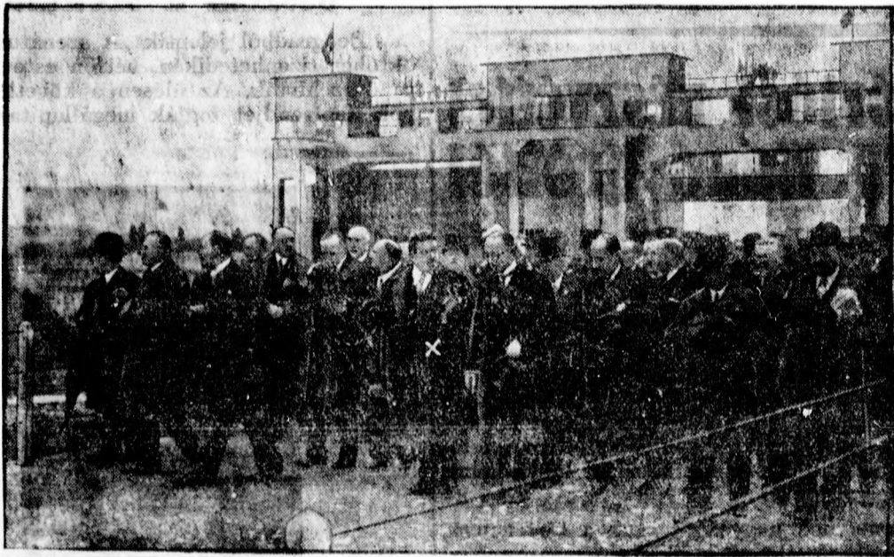
Elszász „villamos szívének” felavatása Herriot (x) miniszterelnök és nagyszámú ven-