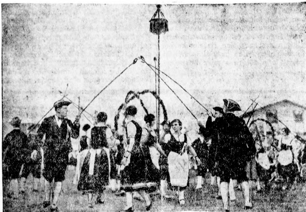
A newyorki németek megtartják az ősi szokásokat. A newyorki német-sváb egyesület legutóbbi ünnepén mutatták be a juhásztáncot