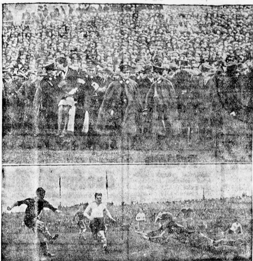
A düsseldorfi német-holland mérkőzésről, amelyet tudvalevően a hollandok nyertek 2:0 arányban. Felső kép: Az 50.000 főnyi tömegben többen elájultak, akiket a mentők szállítottak el. Alsó kép: A német kapus sikerrel ment egy veszélyes lövést.

hogy a kulaiak nagyon kemény ellenfelek lesznek és a Rádnicskinak jól kell játszania, ha győzni akar.