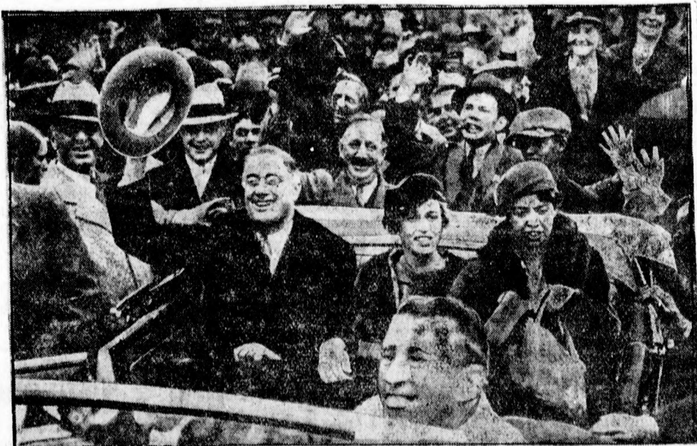
Rooseveltet nagy lelkesedéssel fogadják Warm Springsben, ahol a választási hadjárat fáradalmát akarja kipihenni családjával körében.