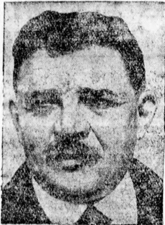
Herriot miniszterelnök legalább huszszor szólalt fel.

A kamara történelmi jelentőségű ülése rengeteg viharos lefolyású volt. Az esti óráktól hajnali háromnegyed hatig,