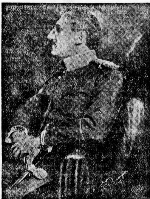
Bensőséges ünneppel üli meg az egész ország lakossága ma Öfelsége Alekszandar király negyvennegyedik születésnapját. A hétköznap zaja elül, a munka meg

pihen, hogy az ország első emberének ünnepe mindenki résztvehessen. A legkisebb faluban éppúgy mint az ország nagy városaiban mindenütt ünnepi előkészületeket tesznek, hogy méltóképpen ülhessenek meg az ország nagy ünnepeit. A templomokban hálaadó istentiszteleteket tartanak és az ország minden templomából imák szállnak fel az egek Urához Öfelsége a királyért.