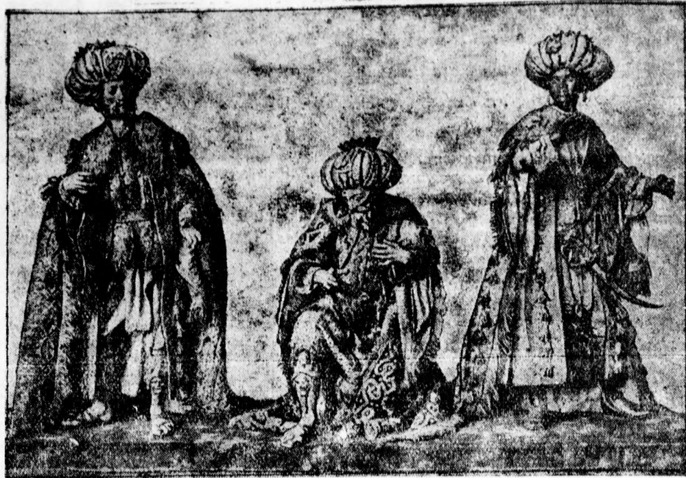
A három király