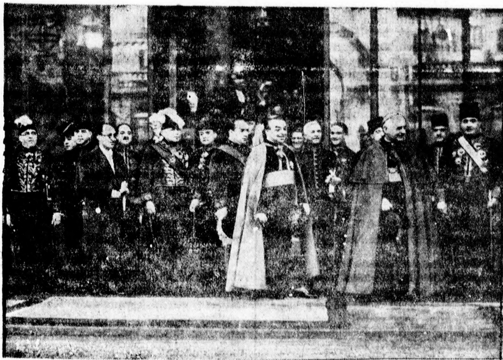
A párisi követség a francia köztársaság elnökénél