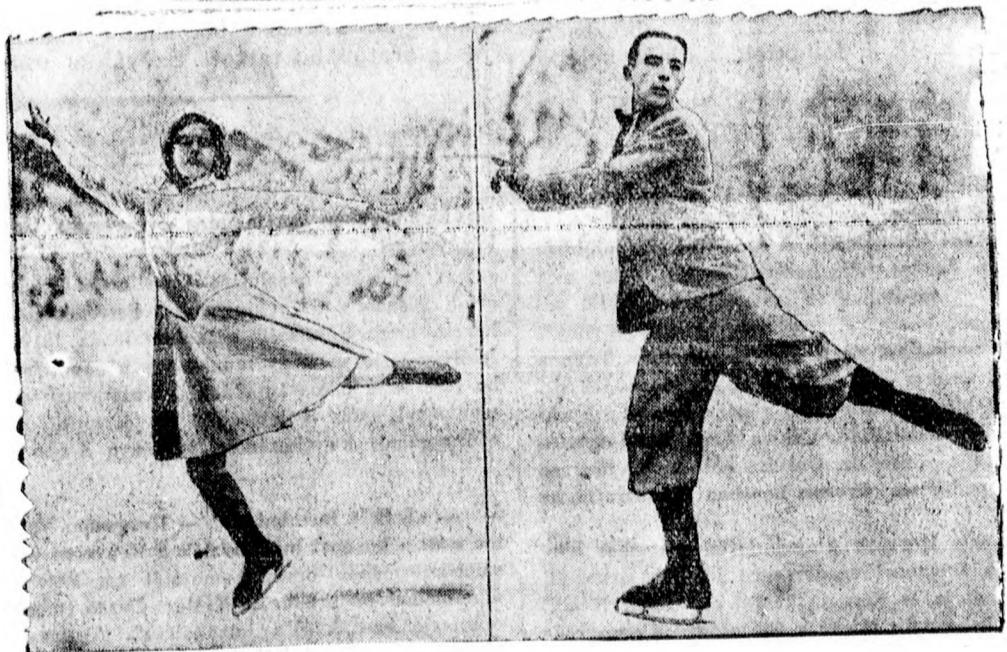
A legjobb német műkorcsolyázók