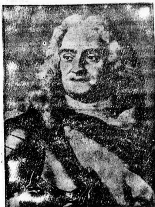
Erős Ágost száz választófejedelem, későbbi lengyel király, aki 1733 február 1-én halt meg. A király halálának évfordulóján Szászországban emlékkünnepélyeket rendeznek