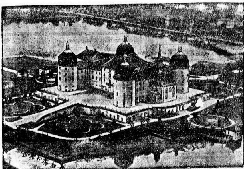
Moritzburg, a Dresden melletti várkastély, amelyet Erős Ágost vadaskastéllá alakított át.