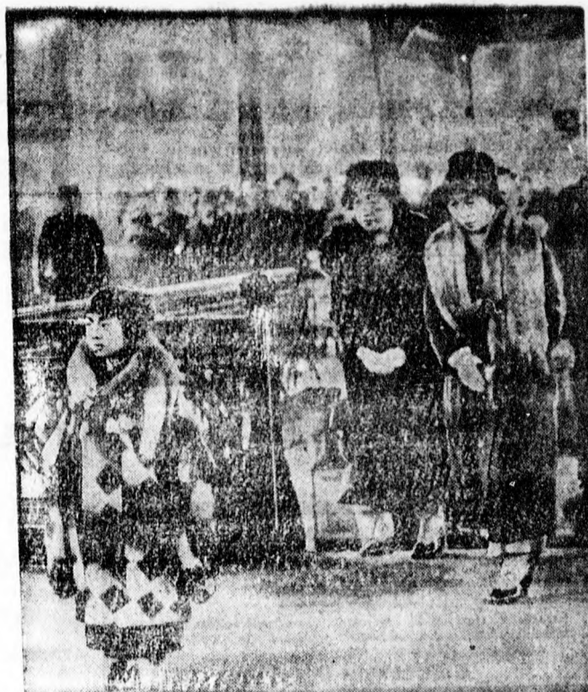
A japán császár leánva a tekiói pályaudvaron