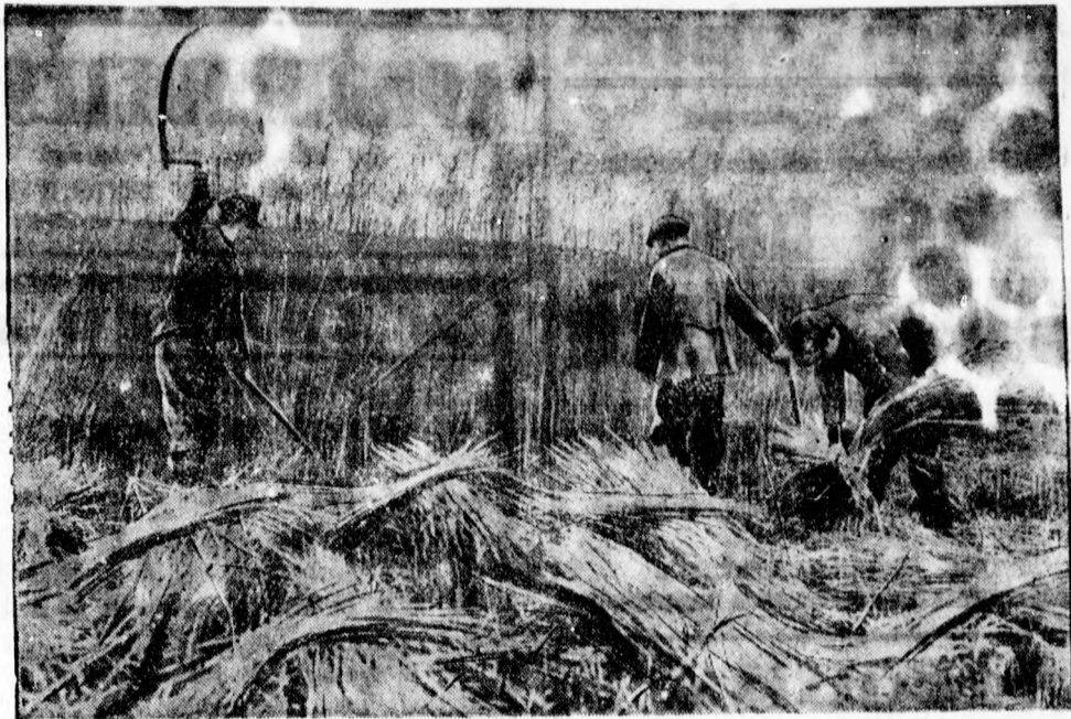
Az erős téli fagyok idején most már mindenütt megkezdődtek a nádvagások

Berlin. 10.05: Zenekari hangy. 18.20: Brahms: F-moll szonáta. 19.10: Vita az operáról. 19.30: Szórakoztató zene. 20.40: Kis hangjáték. 21: A hangverseny folytatása. 22: Táncczene.